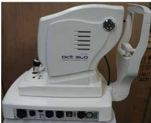
Obrázek 1. Přístroj Spectral Optical Coherence Tomography

Podle některých studií [5] je možné u spectral domain OCT dosáhnout sensitivity až 96 % a specificity 76 %. Cílem naší retrospektivní studie bylo vyhodnotit data získaná díky RNFL analýze ve 4 sledovaných souhrnných kvadran-