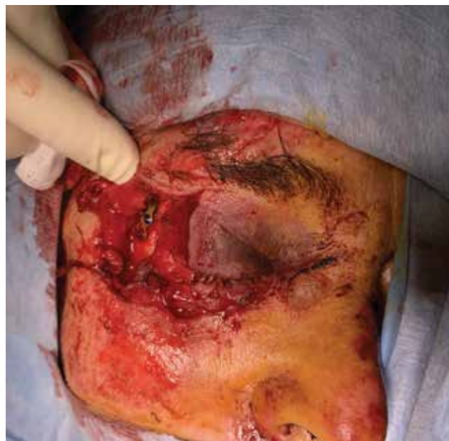
Obrázek 6-a. Těžké poranění očníce a víček při autonehodě. Je patrná již provedená rekonstrukce zlomeniny vnější stěny očníce stomatochirurgem

U všech traumat bychom měli ověřit, zda má pacient platné očkování proti tetanu a zda je rekonstrukci možné provést v lokální anestezii. Obecně ale platí, že pro rozsáhlá poranění víček, poranění slzných cest,