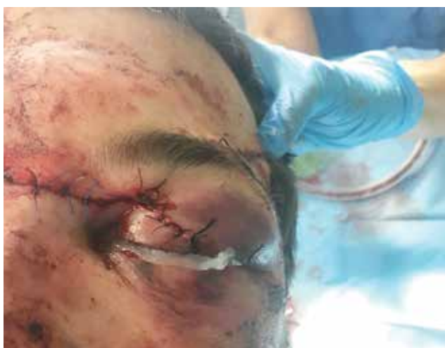
Obrázek 5-b. Stav bezprostředně po rekonstrukci víčka oftalmologem

[19]. Role MR je i důležitá v diagnostice traumatické neuropatie optického nervu.