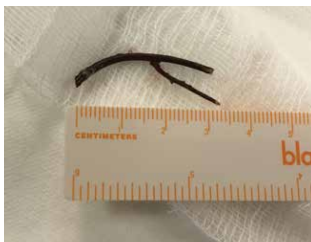
Obrázek 4-b. Extrahovaná větvička z přední části očníce

U kontuzí očníce je nutné pamatovat, že dle některých prací až 29,4 % může být spojeno s blow-out zlomeninou očníce [17]. Proto by tito pacienti měli být důsledně vyšetřeni včetně zobrazovací metody.