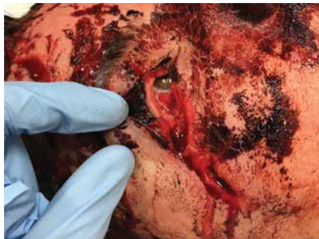
Obrázek 3-a. Otevřená rána zevního koutku, včetně vytrženého dolního kantálního ligamenta. Pacient po autonehodě