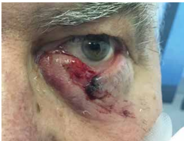
Obrázek 2. Tržné poranění dolního víčka, způsobené malým psím plemenem, bez poranění kanalikulu