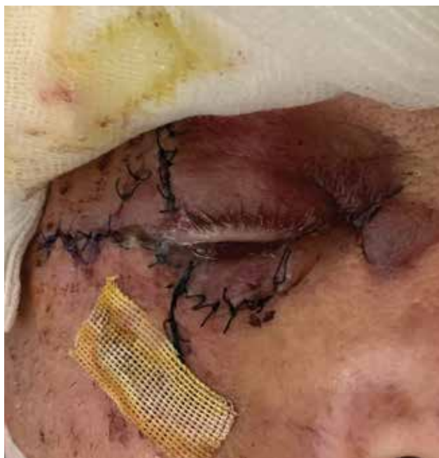
Obrázek 6-b. Nález při kontrole první den po rekonstrukci