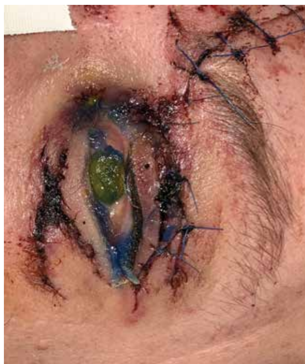
Obrázek 8. Fotografie ukazuje vzácnější komplikaci okuloplastických traumat – pacient po úraze (autonehoda) – pravděpodobně ztrátové poranění horního víčka po primární rekonstrukci – s nálezem expoziční keratitidy při lagoftalmu na podkladě nedovírání oční štěrbinu

Prevalence retrobulbárního hematomu se obecně pohybuje mezi 0,4–1,7 % [36,37,38].