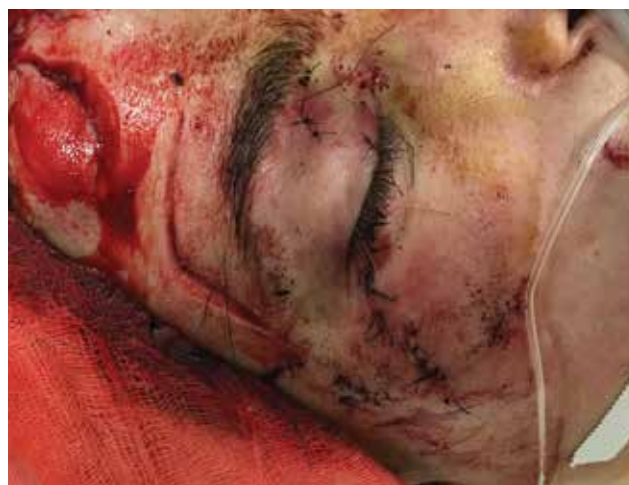
Obrázek 3-b. Stav po rekonstrukci víček oftalmologem