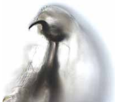
Obrázek 5. Detail pravého rostrálního háčku larvy Oestrus ovis při pohledu z ventrální strany (200x zvětšení)

S myiasou se v našich klimatických podmínkách pravděpodobně můžeme setkat u cestovatelů do jižních krajů po návratu z oblastí s velkým počtem ovcí a tím i střečků. V zemích non-endemických může představovat diagnostickou výzvu pro lékaře neseznámeného s tímto zamořením, obzvláště pokud jsou postiženy jiné orgány než kůže [7]. Napadení člověka střečkem je udáváno v případě nárazu plodné samice do pacientova oka a jeho okolí. Bývá to hlášeno pastýři ovcí a na venkově ve Středomoří, tropických a subtropických zemích [8].