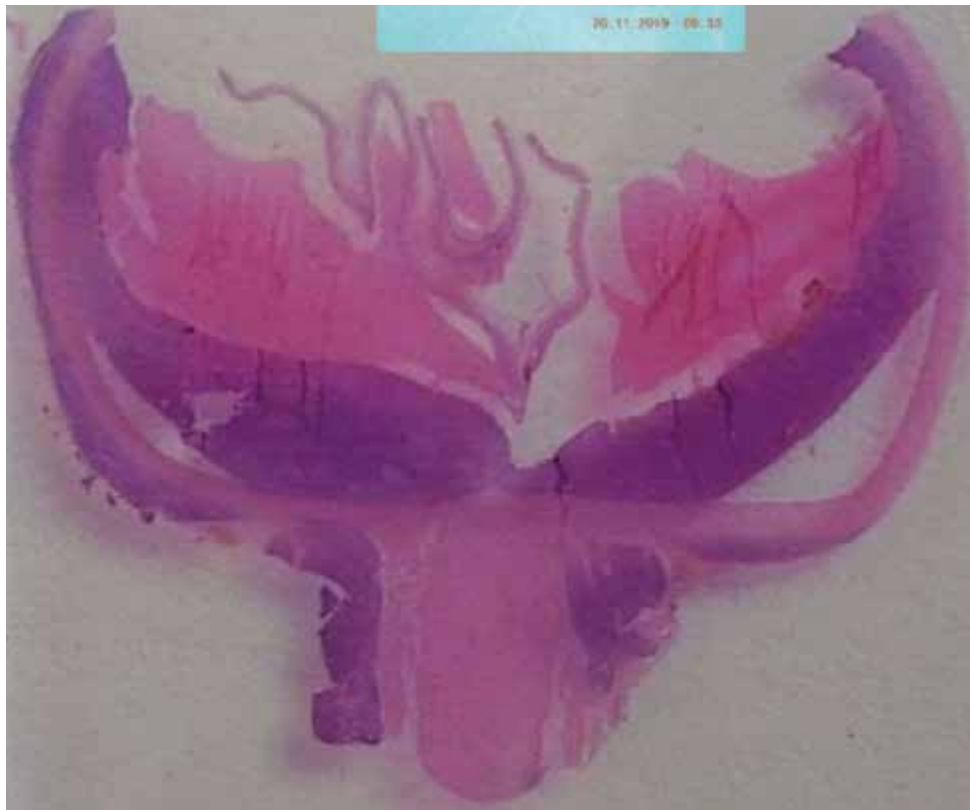
Obrázok 3.: Histologický nález: tumor na zadnej stene bulbu pod cievkou a retrobulbárna infiltrácia okolo zrakového nervu

infiltrácia malými lymfocytmi s jadrom okrúhlym alebo s mierne poprehýbanou jadrovou membránou, hrudkovitým chromatínom, centrálnym jadričkom, malým množstvom cytoplazmy, s tvorbou zárodočných / proliferačných centier, mitotická aktivita je nízka. Rovnaká infiltrácia bola aj v retrobulbárnom tkanive po stranách zrakového nervu.