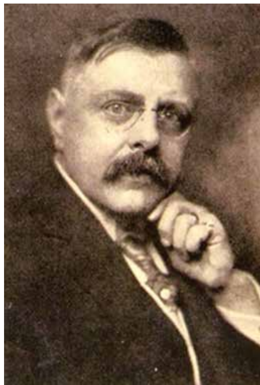
Obrázek 2. Prof. MUDr. O. Lešer [8]