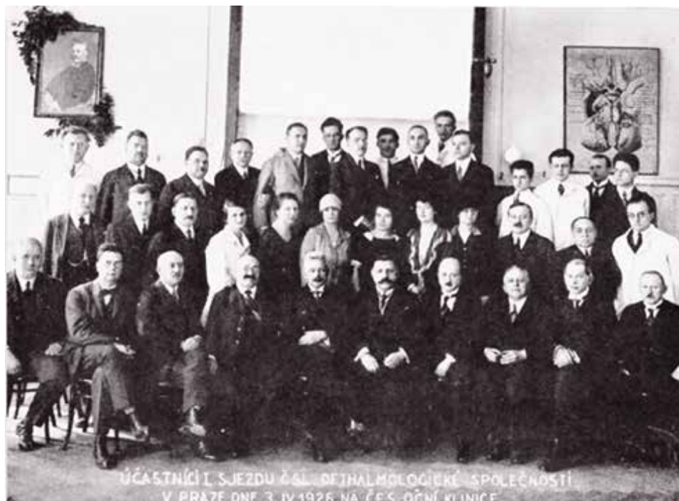
Obrázek 3. Účastníci sjezdu Čsl. Oftalmologické společnosti v Praze dne 3.4.1926 na české Oční klinice [7]

až do roku 1938, kdy se koncem června konal XIII. Sjezd společnosti v Praze, již v dusném prostředí napjaté mezinárodní situace. Jak se potom drobilo území našeho státu, život se před očima rozplýval a zbyla nás jen malá hrstka, vzrůstalo mlčení i ve strádajících pracovnách.“