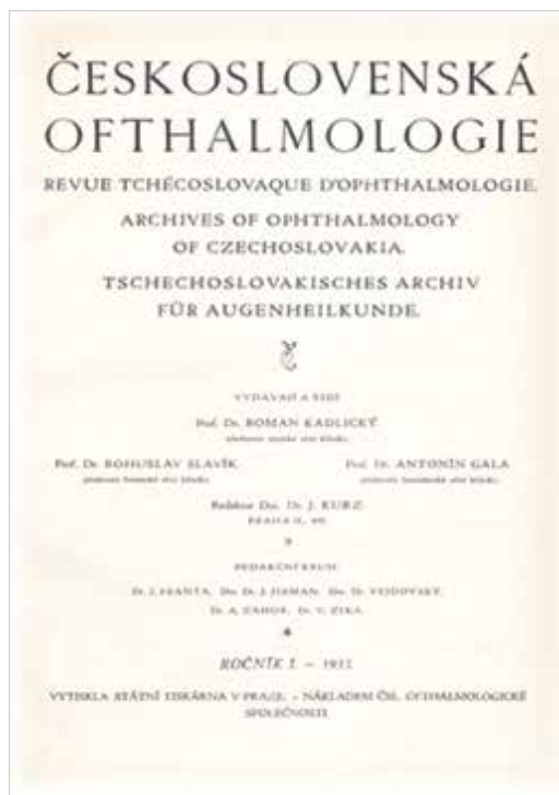
Obrázek 7. Československá oftalmologie, Ročník 1/1933