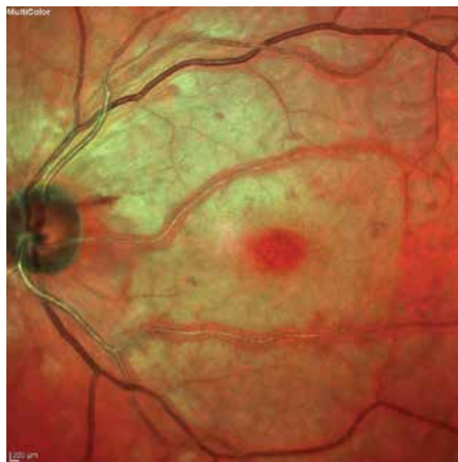
Obrázek 1. Bledý vzhled sítnice s třešňovou skvrnou v makule – příznaky CRAO trvajících 6,5 hodiny CRAO – central retinal artery occlusion

Po několika týdnech od okluze je možné zaznamenat atrofii optického nervu a přítomnost cilioretinálních kolaterál. U 18 % pacientů se do pěti měsíců od okluze rozvíjí