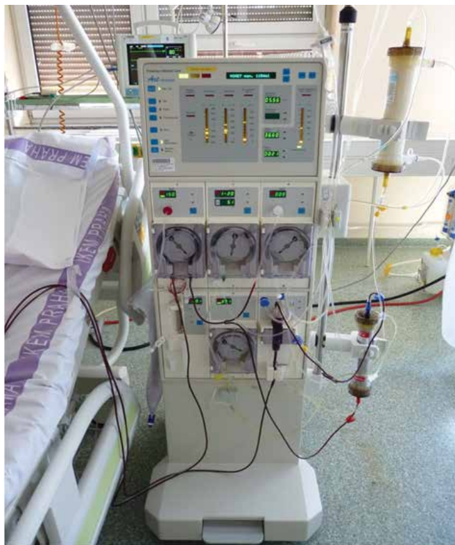
Obrázek 1. Aferetický přístroj nasetovaný na rheoferézu. Dole membránový filtr oddělující plazmu od krevních elementů, nahoře rheoferetický filtr vychytávající makromolekuly. K posteli přichyceny setové linky mimotělního oběhu odvádějící z pacienta a vracející plnou krev zpět do oběhu pacienta

ronektinu [2]. Dochází ke snížení aktivity všech tří drah komplementu. To vede ke zlepšení viskozity krve a plazmy, ke snížení agregace erytrocytů. Nezávisle na základní chorobě dochází ke zlepšení mikrocirkulace. Fibrinogen a další globuliny, jako např. \alpha_2 -makroglobulin, jsou determinantami krevní viskozity a slouží jako makromolekulár-