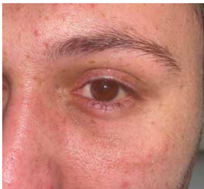
Obrázok 6. Klinický náález 6 týždňov po rekonštrukcii spodiny očnice