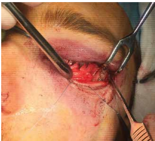
Obrázok 11. Minidlaha fixovaná na laterálny orbitálny okraj po laterálnej kantotómii