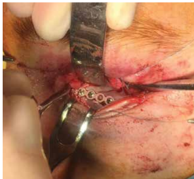
Obrázok 10. Minidlaha fixovaná na infraorbitálny okraj

Na mnohých pracoviskách maxilofaciálnej chirurgie pri liečbe zlomenín s potrebou expozície infraorbitálneho margu v priebehu posledných dvoch dekád narastla preferencia transkonjunktiválneho prístupu cez spojku dolnej mihalnice pre úplnú absenciu kožnej jazvy