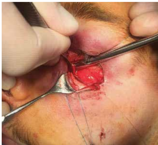
Obrázok 9. Transkonjunktiválny prístup rozšírený laterálnou kantotómiou

TKP – transkonjunktiválny prístup supraorbit – supraorbitálny kožný prístup i.o. – intraorálny prístup