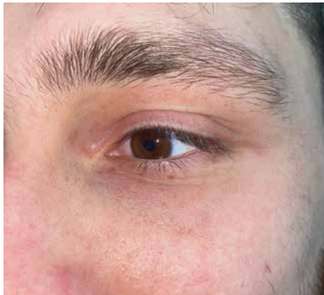
Obrázok 12. Klinický stav 3 roky po transkonjunktiválnom prístupe a laterálnej kantotómii vľavo