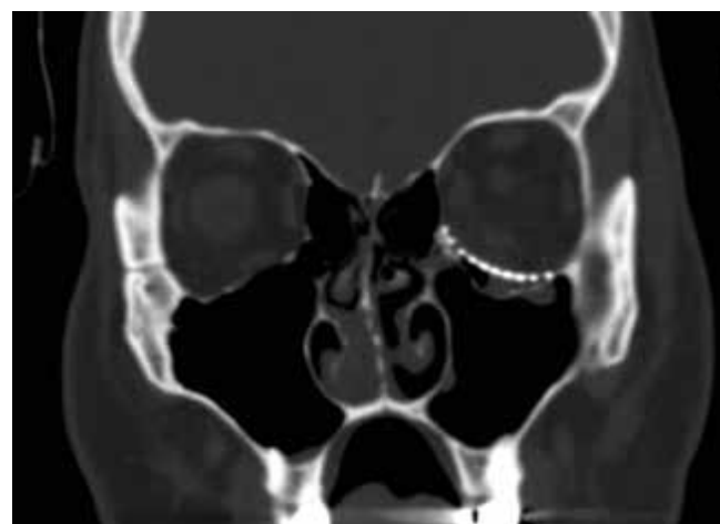
Obrázok 8. Pooperačné CT zobrazenie rekonštrukcie spodiny očnice titánovou mriežkou - koronárny rez