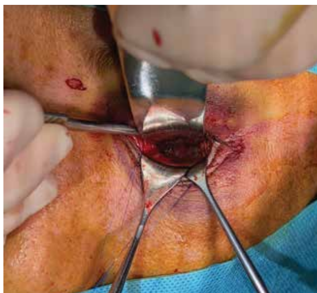
Obrázok 4. Vizualizácia zlomeniny spodiny očnice