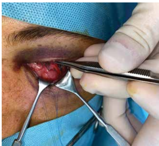
Obrázok 3. Vizualizácia orbitálneho septa preseptálnou preparáciou