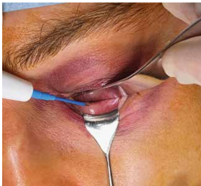
Obrázok 2. Slizničná incízia spojovky monopolárnym nožom