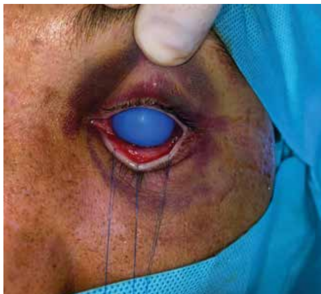
Obrázok 1. Fixačné stehy na dolnej mihalnici a gumový chránič rohovky

zoval tento prístup k vizualizácii spodiny očnice a maxily. Na našom pracovisku využívame transkonjunktiválny prístup ako primárny prístup k vizualizácii a otvorenej chirurgickej liečbe zlomenín dolného orbitálneho okraja a spodiny očnice pravidelne od vzniku pracoviska v roku 2017. Pri transkonjunktiválnom prístupe na infraorbitálne