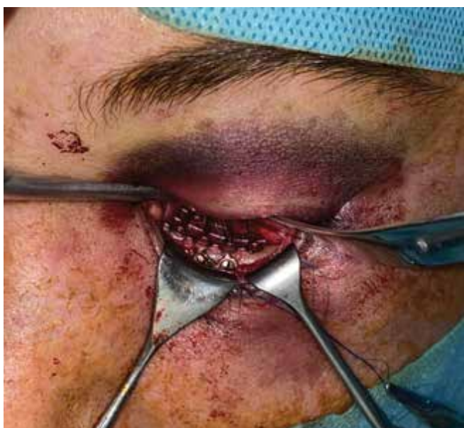
Obrázok 5. Rekonštrukcia zlomeniny spodiny očnice titánovou mriežkou

klinike aktuálne transkonjunktiválny prístup ponechávame prevažne bez suture spojovky a doteraz sme nepozorovali vyššiu incidenciu komplikácií spojených so spontánnym hojením bez chirurgického uzáveru incízie spojovky sutúrou. Z našej skúsenosti transkonjunktiválny prístup poskytuje dostatočnú možnosť vizualizácie infraorbitálneho marga a spodiny očnice a zabezpečuje dobrý prehľad v operačnom poli. Pri rutinnom používaní transkonjunktiválneho prístupu bolo možné skrátiť operačný čas potrebný od prvotnej incízie k vizualizácii dolného orbitálneho okraja. Transkonjunktiválny prístup využívame aj pri bilaterálnych zlomeninách strednej etáže tváre s nutnosťou chirurgickej vizualizácie dolného orbitálneho okraja alebo spodiny očnice unilaterálne, či bilaterálne. Pri chirurgickej liečbe izolovaných zlomenín spodiny očnice, ktorú sme v našom súbore zaznamenali