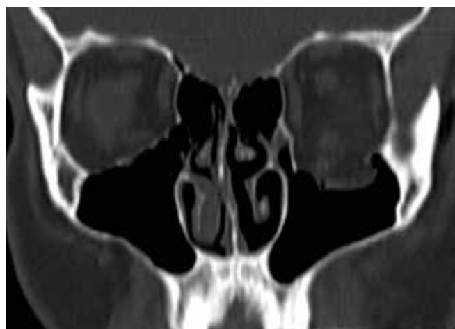
Obrázok 7. Predoperačné CT zobrazenie zlomeniny spodiny očnice vľavo – koronárny rez