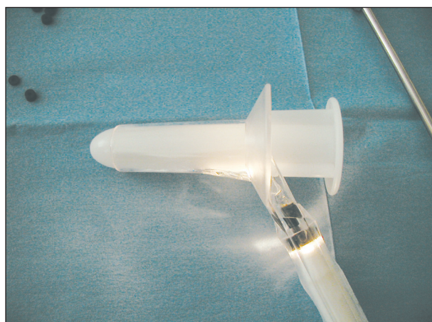
Obr. 3. Anoskop Fig. 3. Anoscope