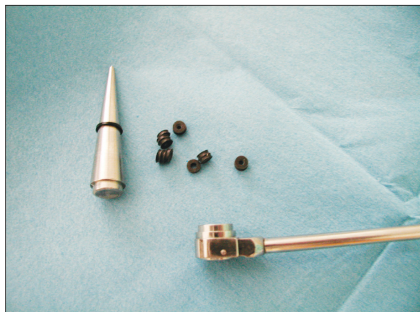
Obr. 2. Detail aplikátoru Fig. 2. Applicator – a detail