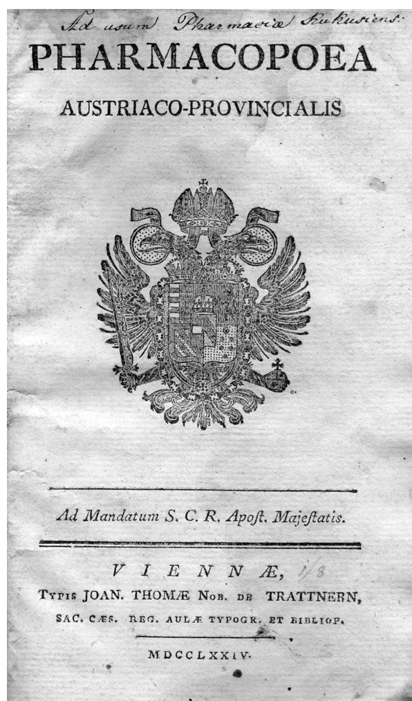
Obr. 1. Titulní list lékopisu z roku 1774

Složení galenických přípravků autoři obvykle upravili a vypustili z něho ty látky, které v daném přípravku nepovažovali za důležité. Někdy také pozměnili způsob přípravy a případně též upravili název článku. Opustili původní rozdělení článků do tříd podle lékových forem a seřadili články podle abecedy. Navíc do provinciálního lékopisu zařadili nové statě, např. soupis používaných léčivých a pomocných látek ( Materia pharmaceutica , v pozdějších vydáních přejmenovaný na Materia medi-