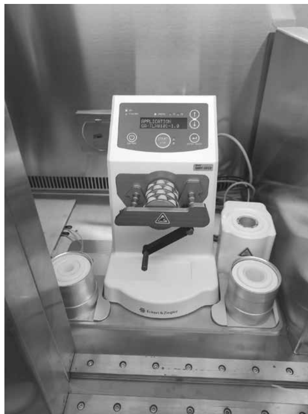
Obr. 2. Syntetizační modul KitLab

Systém KitLab představuje syntetizační modul, který nabízí automatizované řešení pro přípravu radiofarmak značených galliem-68 z licencovaných sad (kitů pro přípravu radiofarmak). Obdobně jako i jiné syntetizační