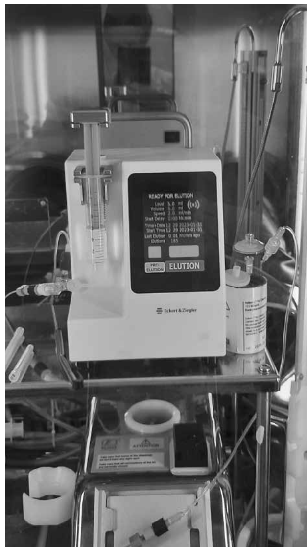
Obr. 1. Eluční pumpa EluGen

EluGen je velmi jednoduchý systém (pumpa) k automatické eluci radionuklidového generátoru Gallia-pharm. Svojí funkcí umožňuje provést preeluční proplach radionuklidového generátoru ^{68}\text{Ge}/^{68}\text{Ga} , ale i provedení eluce radionuklidového generátoru ke značení peptidů dostupných v podobě kitů pro přípravu radiofarmak. Nahrazuje tak manuální proplach