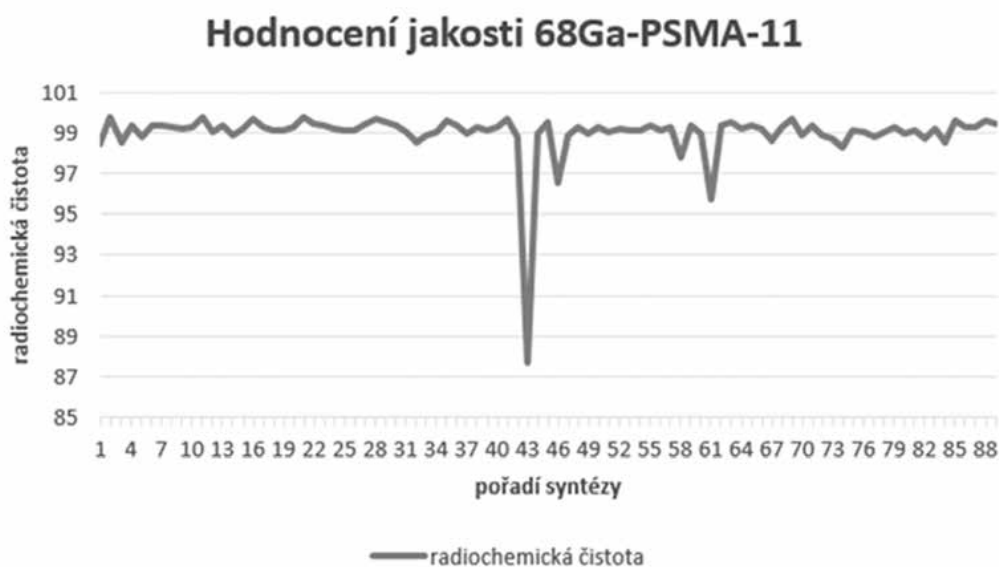
Obr. 3. Radiochemická čistota radiofarmaka ^{68}\text{Ga} -PSMA-11 ÚL MOÚ Brno

Po stránce profesní expozice radiofarmaceutických pracovníků MOÚ nedochází při rozšíření spektra PET radiofarmak o ^{68}\text{Ga} -PSMA-11 k významným změnám v kolektivních dávkách na prsty ani tělo. V prstové dozimetrii jsou kolektivní roční dávky 104,9 mSv v roce 2021 a 105,9 mSv v roce 2022 (nárůst o 0,95 %), v celotělové dozimetrii jsou kolektivní roční dávky 0,26 mSv v roce 2021 a 0,20 mSv v roce 2022 (pokles o 23 %), což představuje velmi nízké hodnoty profesní expozice, které jsou tak nejen legislativně ale i společensky akceptovatelné. Vzhledem k používání jednoho společného dozimetru pro přípravu všech ostatních radiofarmak (značených fluorem-18 a techneciem-99m), není však možné v kolektivu pracovníků ani v případě jednotlivce určit hodnotu profesní expozice odpovídající přípravě a hodnocení jakosti ^{68}\text{Ga} -PSMA-11.