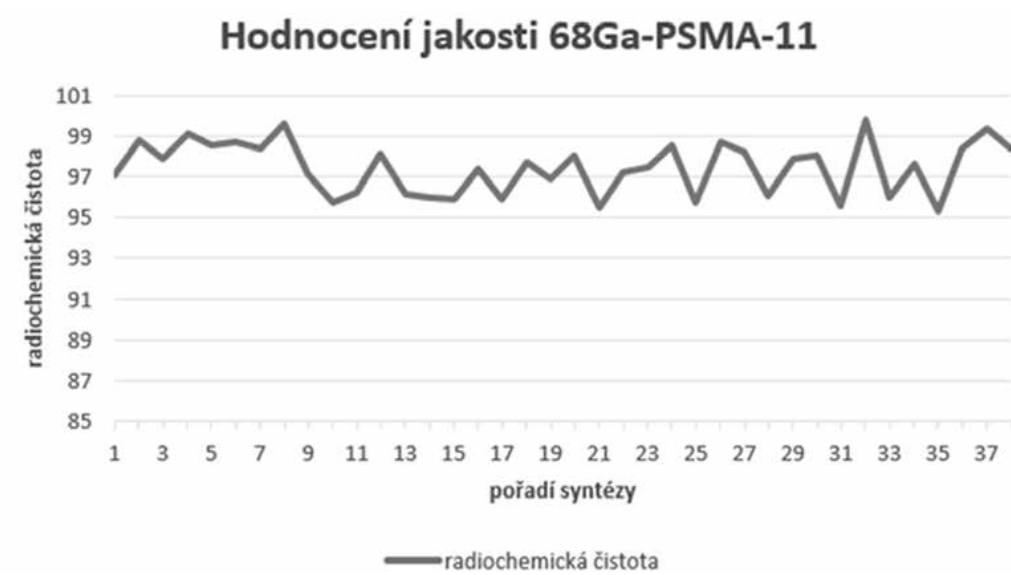
Obr. 5. Radiochemická čistota radiofarmaka 68 Ga-PSMA-11 ÚL České Budějovice