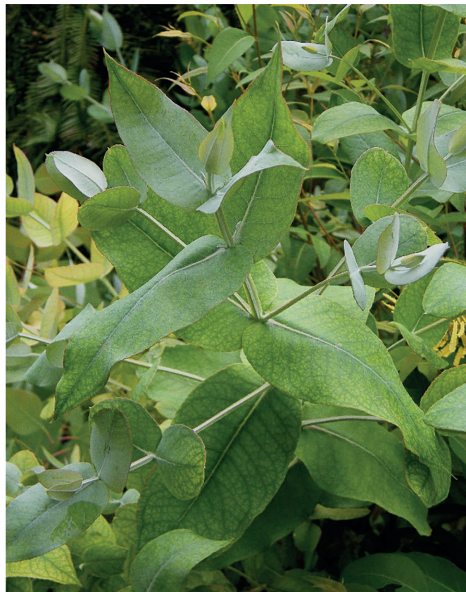
Obr. 2. Blahovičnick kulatoplodý ( Eucalyptus globulus )

růstu a motility bakterií, inhibice tvorby biofilmů, působí také synergicky s antibiotiky, jako je amoxicilin, gentamicin či penicilin G. Inhibuje rovněž růst různých druhů hub, ovlivňuje tvorbu jejich buněčné stěny, mitochondriální aktivitu a adhezivitu buněk. U chřipkového viru působí synergicky s oseltamivirem a zvyšuje aktivitu IRF3 (Interferon Regulatory Factor 3) (2).