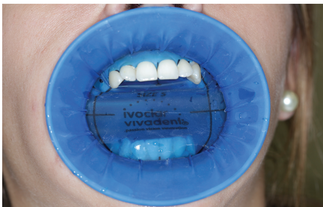
Obr. 3 OptraDam plus