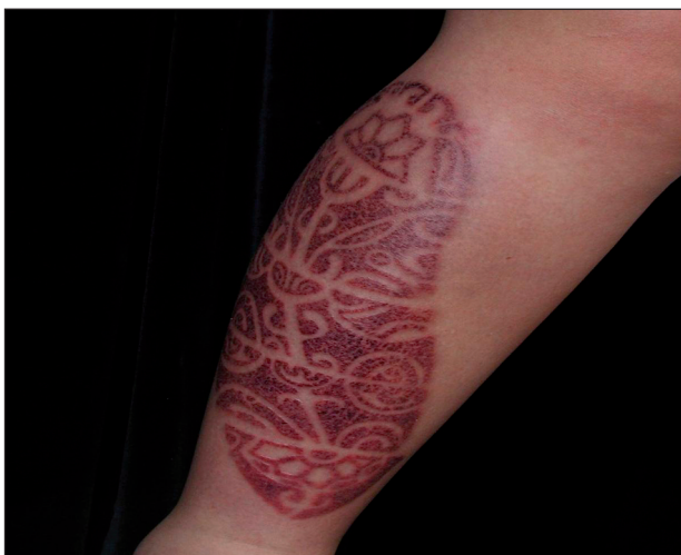
Obr. 5. Kontaktní ekzém na bérce u pacienta č. 2.