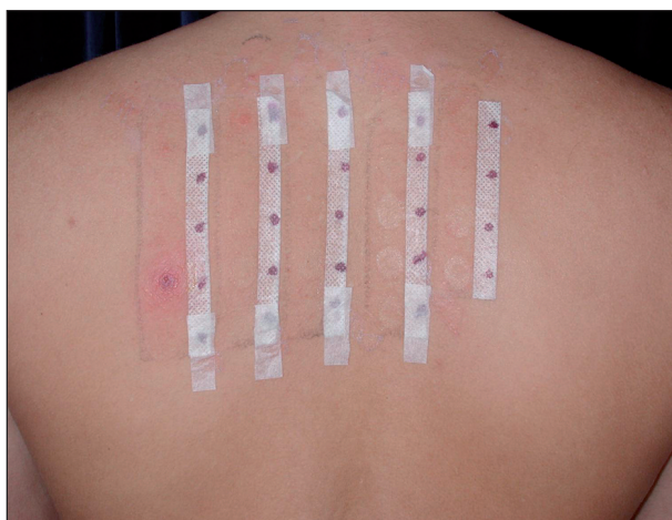
Obr. 4. Pozitivní epikutánní test na PPD a benzokain u pacienta č. 1.

vyšetřena v květnu 2004. Na počátku května si nechala na dovolené v zahraničí provést na bérce tetováž henou. Sedmý den se objevily v místě tetováže vezikuly na výrazně zánětlivém a edematózním podkladě (obr. 5, 6). Lokální nálezy se stále zhoršoval a byl provázen silným pruritem. Byla léčena 12 dní za hospitalizace lokálními kortikosteroidy s elastickou bandáží, ale i kortikosteroidy celkovými v dávce 200 mg hydrokortisonu denně po dobu 4 dní a antihistaminiky. Byla propuštěna zhojena. V únoru 2005 byly provedeny epikutánní testy rutinní sadou Trolab Hermal a byla prokázána kontaktní přecitlivělost na PPD na +++ (obr. 7). Testy byly odečítány po 24–48 a 72 hodinách. Primární senzibilizace vznikla nejspíše po barvení vlasů tmavou barvou v minulosti, aniž došlo ke vzniku kontaktního ekzému.