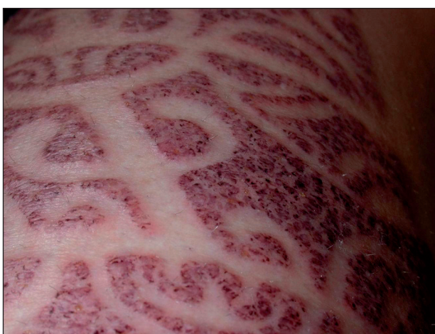
Obr. 6. Detail kontaktního ekzému na bérce u pacienta č. 2.