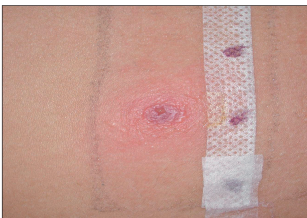
Obr. 7. Pozitivní epikutánní test na PPD u pacienta č. 2.

a 96 hodinách. Tím, že epikutánní testy na čistou henu byly negativní, byla zpětně potvrzena přítomnost PPD v heně, kterou bylo prováděno kreslení na kůži u obou pacientů.