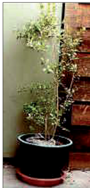
Obr. 1. Hena - lat. Lawsonia Inermis .

Hena, latinsky Lawsonia inermis , je keřík s malými, zelenými, vonnými lístky, z jehož květů se vyrábějí vůně a parfémy, listy a kůra rostlin se zpracovává na prášek k barvení vlasů a malování kůže (obr. 1). Květy jsou bílé až červené barvy, vydávají silnou sladkou vůni považovanou za afrodisiakum. Dorůstá délky průměrně 2–3 metrů, ale i více, a pro své barvicí účinky na kůži je známa a pěstována více než 5000 let. Roku 1890 se dostala do Evropy, kde byla používána nejen k barvení vlasů, ale i při léčbě různých kožních chorob. Roste na nejrůznějších místech světa, např. v arabských zemích, Egyptě, Tunisu, Indii, Pákistánu, Maroku, Austrálii a jinde. Přírodní barvivo heny se využívá tisíce let nejen k péči o vlasy, ale i jako prostředek ke zkrášlení těla, malování rtů i nehtů. Hena keře Lawsonia inermis je červená, Lawsonia alba je bílá varianta, Lawsonia spinosa je varianta černá. Přírodní barvicí vlastnosti jsou dány obsahem taninů. Prášek z heny je zelený. Sušené listy heny se smíchávají s vodou na pastu, která se