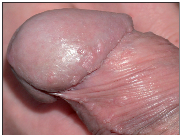
Obr. 5 Condyloma acuminatum.

álním životem pro obavu z pohlavní nemoci dostaví poprvé k lékaři. Přibližně od 30. roku věku mají projevy tendenci ke zmenšování.