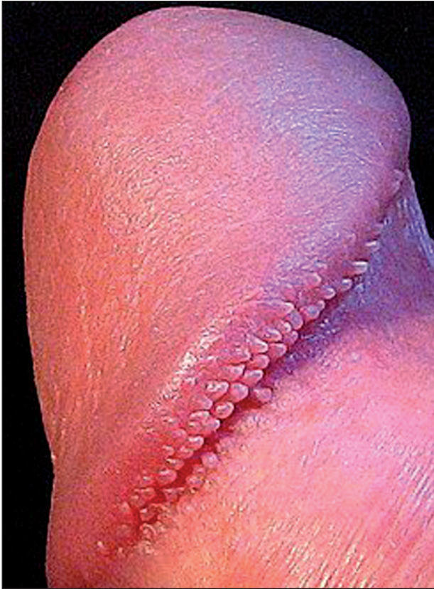
Obr. 1. Papillae coronae glandis.