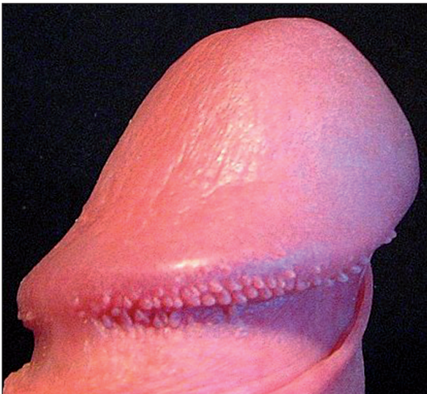
Obr. 2 Papillae coronae glandis.

zy u novorozenců dokonce i u orangutanů (4). Anglický termín „pearly penile papules“ byl zaveden, aby mylně nezavdával dojem vztahu k vlasovému folikulu (6). V současné době jsou PCG považovány za fylogenetická rezidua s histologickým obrazem akrálních angiofibromů.