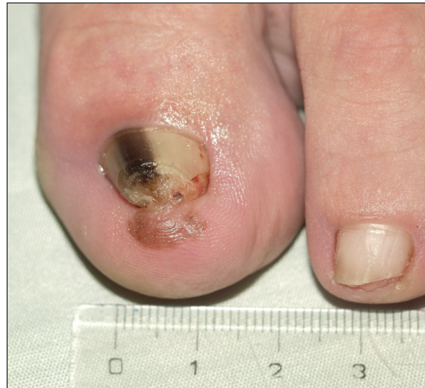
Obr. 4. Akrolentiginózní melanoma in situ , Hutchinsonovo znamení.

lunuly nacházíme v nehtovém lůžku (23). Následkem jsou hnědočervené až černé dyskolorace. Bývají oválné, ale mohou vznikat i třískovité hemoragie nebo lineární pruhy. V odborné literatuře je popsána řada obdobných stavů, pojmenovaných vždy podle příslušného sportu (angl. „ jogger's toenail , skier's toe , tenis toe , golfer's nails “ a další) (1, 3, 18, 23, 25, 28). Diferenciální diagnostika může působit obtíže především při podezření na akrolentiginózní variantu maligního melanomu. K upřesnění diagnózy slouží dermatoskopie či biopsie. K podezření na maligní melanom vede přesah dyskolorace do periunguální oblasti (Hutchinsonovo znamení) a nepravidelné zbarvení léze (15, 23) (obr. 4). Při akutním subunguálním hematomu připadá v úvahu drenáž, při déle trvající bolestivosti je nutné vyloučit postižení skeletu (23, 28). Hojení těchto nálezů je spontánní, ale je limitováno rychlostí růstu nehtové ploténky a může tak trvat 12 až 18 měsíců (10). Časem dochází k absorpci hematomu v lůžku a případná dyskolorace ploténky následně odrůstá spolu s nehtem (28). V prevenci se uplatňují vhodně přiléhající obuv a zastřížení nehtu mírně za laterální okraj prstu a spíše rovně. Nákup sportovní obuvi je doporučován spíše odpoledne a po sportu, kdy noha mírně sesedá (10).