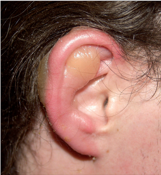
Obr. 7. Omrzliny boltce 2. stupně.

Léčba omrzlin byla v posledních letech přehodnocena. V současnosti se doporučuje rychlé zahřátí ve vodní lázni o teplotě kolem 40 °C po dobu 20 minut (podle různých autorů od 38–44 °C) (3, 4, 23, 28). Pokud již byla postižená oblast takto ošetřena, je velice důležité zabránit jejímu opakovanému prochladnutí (např. při převozu), které by mělo mnohem závažnější následky než původní omrznutí (28). Nově se doporučuje heparinizace k usnadnění prokrvení v trombotizovaných periferních cévách. Účinný by měl být také pentoxifylin a protizánětlivé látky celkově (nesteroidní antiflogistika, podle některých studií methylprednisolon) (4). Také by měla následovat profylaxe tetanu.