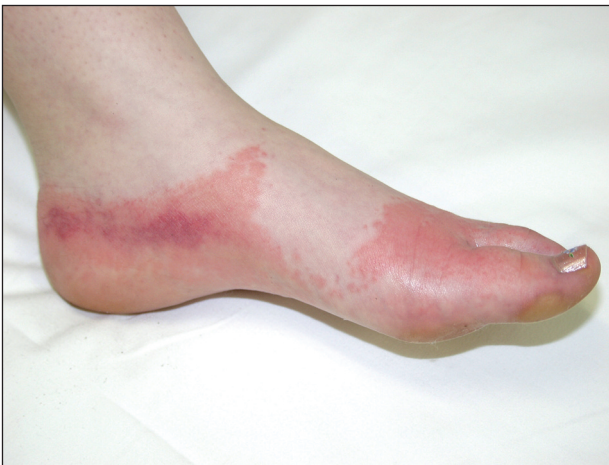
Obr. 10. Kontaktní ekzém na obuv.