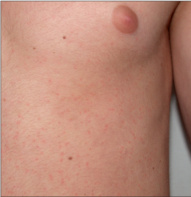
Obr. 11. Cholinergní kopřivka.