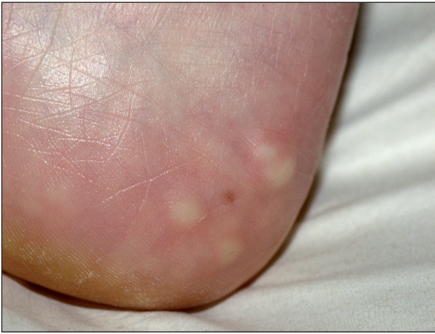
Obr. 2. Piezogení papuly na patě.