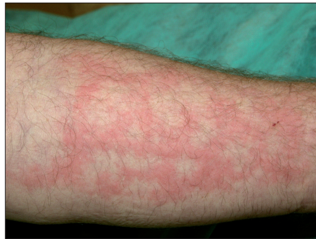
Obr. 13. Chladová kopřivka.

Solární kopřivka se objevuje několik minut po vystavení kůže slunci nebo umělým světelným zdrojům. Ustupuje většinou do hodiny po ukončení expozice (4, 24, 28, 30). Počátečním příznakem je svědění, následované erytémem a urtikariálním výsevem. Častěji než na opakovaně exponovaných oblastech (obličej, ruce) dochází k výsevu na místech méně často vystavených záření (trup). V léčbě první linie jsou doporučována antihistaminika, jako druhá linie pak desenzitizační fototerapie, případně PUVA (5). Pokud akční spektrum leží v UV oblasti, je prevencí účinná fotoprotekce, a to externí nebo