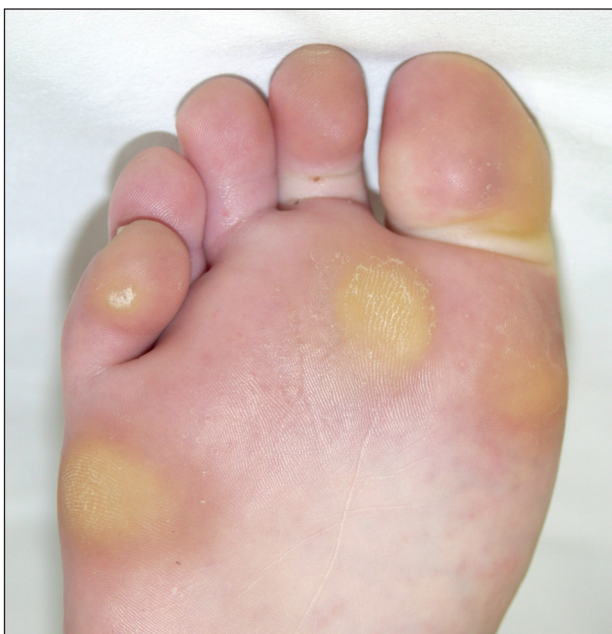
Obr. 1. Mozoly na chodidle a palci, vulgární veruka na 5. prstu.

Mozol vzniká jako adaptační změna v kůži při opakovaném tření nebo tlaku, a to často také v místech dřívějších traumatických puchýřů (6, 18, 25, 28, 30). Jde o tlakovou hyperkeratózu. U sportovců, stejně jako v běžné populaci, jsou nejčastěji postiženy ruce