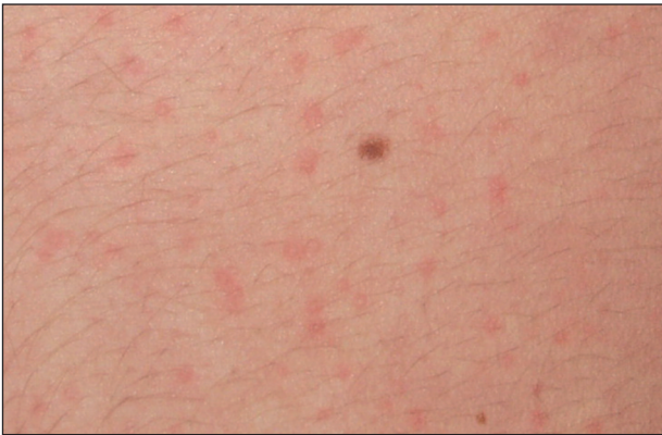
Obr. 12. Cholinergní kopřivka, detail.

a hrudník, ale může se šířit na končetiny i generalizovat (obr. 11, 12). Cholinergní kopřivka může být doprovázena celkovými příznaky, podobně jako jiné urtikárie. V léčbě se doporučuje profylaktické podání antihistaminik před expozicí vyvolávajícím faktorům (6, 23, 28). Prevencí je eliminace zjištěných příčin (28).