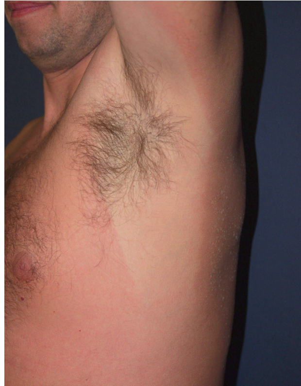
Obr. 8. Erythema solare.

Řada sportovců podceňuje účinnou fotoprotekci. Opakované spálení sluncem (obr. 8) podobně jako i kumulativní UV dávka zvyšují riziko melanocytových i nemelanocytových kožních nádorů. Riziku jsou vystaveni např. cyklisté, běžci, tenisté, veslaři a další. Expozice UV u lyžařů je zvýšena odrazem záření od sněhu a jeho celkově vyšším množstvím vzhledem k menší tloušťce atmosféry ve vyšších nadmořských výškách (18, 24, 25, 28). Zvýšená opatrnost je na místě v případech užívání léků s rizikem fototoxické reakce (tetracykliny, hydrochlorothiazid, amiodaron a další) (10, 24, 30).