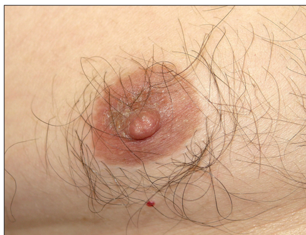
Obr. 6. Poranění bradavek při sportu, Nordic walking.

Třením s oděvem dochází ke vzniku bolestivých erozí a iritační dermatitidy na bradavce i areole (obr. 6). K jejich vzniku přispívají hrubá vlákna oděvu a chlad, kdy jsou prsní bradavky vzpřímené (23, 25, 28).