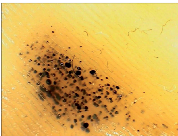
Obr. 5. Černé paty, dermatoskopický obraz.

Jde o častý nález především u mladších sportovců. Vzhledem k relativně tenké vrstvě podkožního tuku jsou kapiláry v dermálních papilách při hranici s epidermis vystaveny při intenzivním sportu značnému tlaku a střížným silám. To vede k jejich poranění a následně ke vzniku horizontálně uspořádaných, bodových, intraepidermálních a intrakorneálních hemoragií (3, 6, 10, 28, 29). Tyto léze jsou asymptomatické. Vyskytují se nejčastěji při horní hraně paty nad hranicí silnější plantární kůže, kde jsou podkožní kapiláry chráněny menší vrstvou tkáně (15, 18, 23, 28, 31). Postižení bývají například tenisté, fotbalisté nebo basketbalisté. Jediným úskalím tohoto benigního nálezu je možná záměna s maligním melanomem (3, 6, 10, 15, 18, 23, 28, 29, 31). V diferenciální diagnostice pomáhá anamnéza sportovních aktivit a často oboustranný nález. Dermatoskopický obraz je většinou jednoznačný (obr. 5). Diagnóza může být také potvrzena jemným odstraněním několika petechií skalpe-