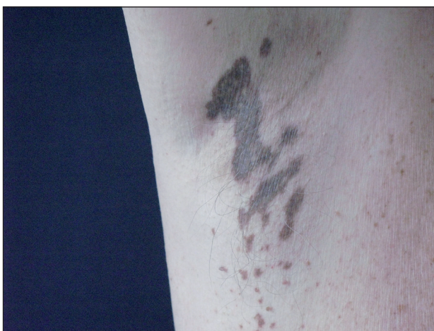
Obr. 2. Hnědočerné makuly v axile, detail.