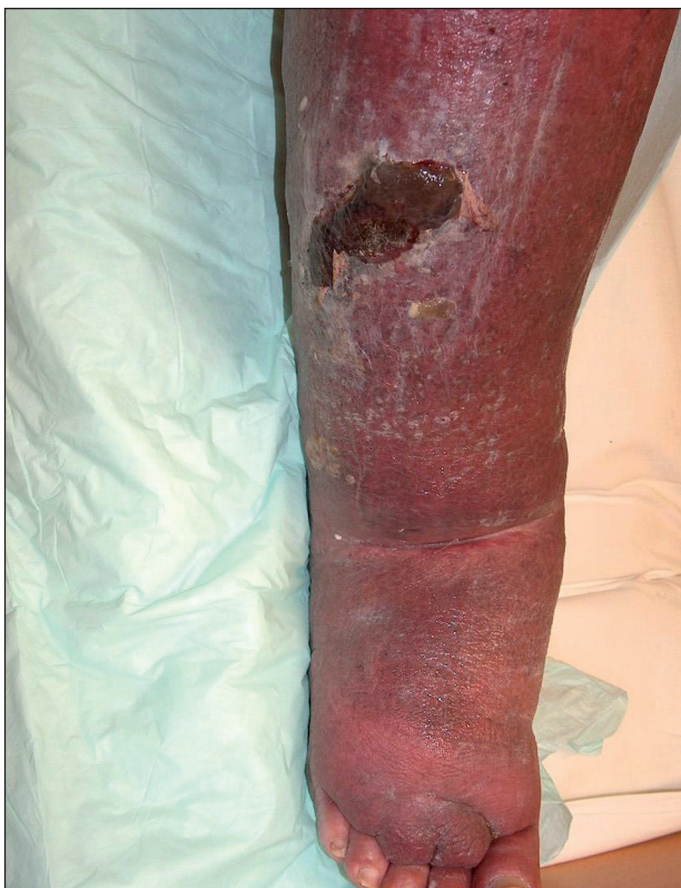
Obr. 4. Flebolymfedém dekompenzovaný probíhajícím erysipelem.

typ lymfedému se označuje otok, na němž se vedle sekundárního lymfedému podílí přidružená choroba – např. lipedém, myxedém, chronická žilní insuficience, zánětlivá onemocnění kloubů a další (obr. 4).