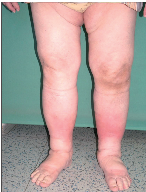
Obr. 2. Sekundární lymfedém (recidivující erysipely).

Sekundární lymfedém je častější. Příčina je známá. Utváří se na původně nepostíženém mizním systému v důsledku poškození mizních cest patologickým procesem nebo jejich útlakem. Poškozením vzniká překážka v oběhu lymfatického systému. Otok se vyvíjí během měsíce až několika roků (obr. 2, 3). Rozlišujeme benigní a maligní typ sekundárního lymfedému. Benigní typ je většinou postinfekční (viry, plísně, nejčastěji bakterie – erysipel, často recidivující), pooperační, postiradiační, posttraumatický, po popíchání hmyzem, arteficiální, parazitární (nejčastější příčina v rozvojových zemích). Maligní typ vzniká útlakem nebo invazí primárního nádoru nebo metastáz do mizního systému. Termínem kombinovaný