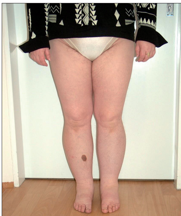
Obr. 1. Primární lymfedém dolních končetin (akcentace obtíží na levé dolní končetině).

Primární lymfedém je výsledkem primární poruchy v lymfatickém systému – ať už na podkladě hypoplazie či hyperplazie miznic. Záleží na stupni insuficience a na velikosti lymfatického břemene. V důsledku hromadění makromolekulárních bílkovin dochází k progredující fibrotizaci podkoží, a tak k nezvladatelnému stavu (1). Může být provokován infekcemi, traumaty, hormonálními změnami v dospívání, těhotenství a v menopauze. Jestliže se otok manifestuje brzy po narození do druhého roku života, nazývá se lymphoedema congenitum . Rozvoj otoku mezi druhým a třicátým pátým rokem života označujeme jako lymphoedema praecox , po třicátém pátém roce života jako lymphoedema tardum . Primární lymfedém může být i geneticky podmíněný (Nonneho–Milroyův syndrom – autosomálně dominantně dědičný lymfedém, nebo Meige syndrom – lymfedém podmíněný dědičným faktorem Mendlova typu, uplatňující se recesivně) (obr. 1).