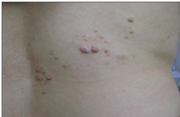
Obr. 1. Segmentální neurofibromatóza, bederní krajina.

Třicetiletá žena se dostavila na I. dermatovenerologickou kliniku FN U sv. Anny v Brně k vyšetření projevů v pravé bederní krajině. Před pěti lety si nechala odstranit v této lokalizaci hnědou papulu, která byla histologicky vyšetřena s nálezem verukózního névu, pravděpodobně se již tehdy jednalo o neurofibrom. V průběhu několika let se v okolí jizvy objevilo několik měkkých světle hnědých papul, v původní jizvě byla palpovatelná anetodermie (obr 1.)