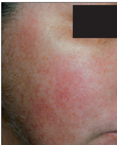
Obr. 1. Erytematotelangiektatická rozacea.

Pro tento typ rozacey je typický flushing – zprvu přechodný, pak trvalý erytém. Důležitá je jeho frekvence, doba trvání, rozsah a intenzita. Flushing u rozacey trvá většinou déle než 10 minut, čímž se liší od krátkodobého