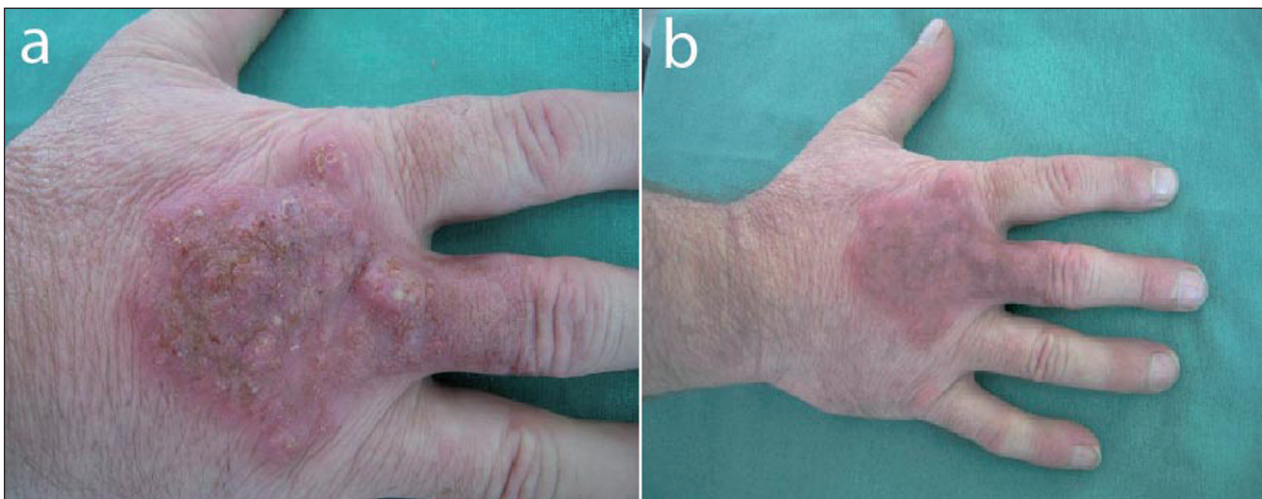
Obr. 2. Pacient č.2: a) dorsum pravej ruky – pred liečbou, b) dorsum pravej ruky – po 4 týždňoch liečby klindamycínom.

s následným perorálnym podávaním v dávke 4 x 600 mg. Lokálna terapia zahrňovala antibiotickú a jódovú externú.