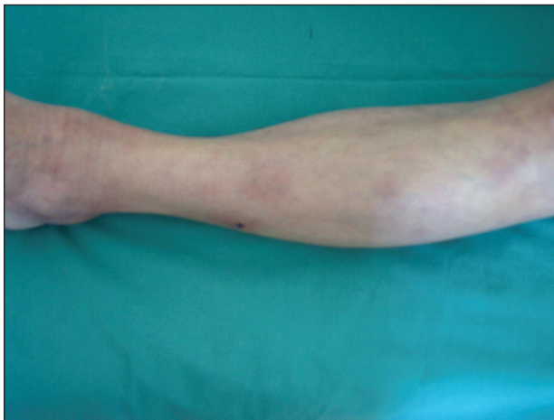
Obr. 1. Metastatická varianta Crohnovy choroby klinického obrazu erythema nodosum.