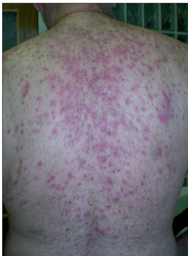
Obr. 1. Akneiformný exantém u pacienta pri liečbe erlotinibom pre metastatický nemalobunkový karcinóm pľúc.

(11). Najčastejšími lokalitami sú seboroické zóny na tvári, v kapilícii, na hrudníku a chrbte (1) (obr.1). Niekedy sa prejavy môžu vyskytnúť aj na dolnej časti chrbta, brucha, ramenách i dolných končatinách. Primárnou léziou je zapálená folikulárne viazaná papula alebo pustula, komeďa sa nikdy nevyskytuje (2). Intenzita výsevu varíruje od ľahkých až po ťažké formy. Mikrobiologické kultivačné vyšetrenie iniciálnej primárnej lézie je negatívne (11). Akneiformné erupcie sa po zahájení terapie objavujú pomerne rýchlo, medián je v literatúre uvádzaný interval 8–21 dní (1), najčastejšie 7–10 dní (6, 11) od začiatku terapie. Prejavy sú často sprevádzané až neznesiteľným svrbením (1). Štádium toxicity sa hodnotí vzhľadom k rozsahu prejavov podľa NCI-CTCAE (National Cancer Institute – Common Terminology Criteria for Adverse Events, U.S. Department of health and human services), verzia 4.0 (9) (tab.1).