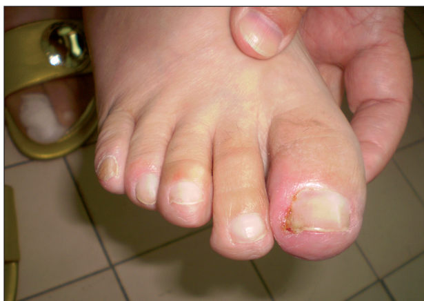
Obr. 4. Paronychium na haluxe pravej dolnej končatiny pri liečbe cetuximabom pre metastatický adenokarcinóm hrubého čreva.

Sú pozorované u 10–15 % pacientov a radia sa medzi neskoršie prejavy liečby. Zväčša začínajú obyčajne po 4–8 týždni terapie (1, 2, 7) (obr. 4). Sú pre pacientov veľmi bolestivé, limitujúce manuálnu prácu, nosenie bežnej obuvi. Často imitujú prejav unguis incarnatus, taktiež častá je sekundárna infekcia Staphylococcus aureus . Postihnuté môžu byť všetky prsty, no najčastejšie dochádza k postihnutiu palcov na rukách a nohách. Dôležité sú preventívne opatrenia – nosenie pohodlnej, voľnej obuvi, vyvarovanie sa traumatizácii (napríklad strihanie nechťov príliš nakrátko, ohrýzanie nechťov atď.) V lokálnej terapii sa uplatňujú kortikosteroidy, antiseptické, antibiotické externá, v horších prípadoch v celkovej terapii antibiotiká a niekedy liečba musí byť doplnená chirurgickou intervenciou.