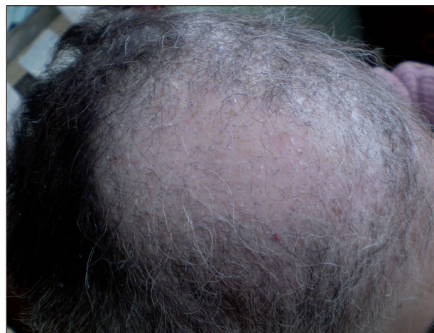
Obr. 3. Alopecia androgénneho typu s výraznou xerózou u pacientky pri liečbe erlotinibom pre metastatický nemalobunkový karcinóm pľúc.

cyklov a potom blokáda EGFR v jednom čase samozrejme vyúsťuje v rôzne vlasové zmeny, ktoré sú závislé na type vlasu (v niektorých častiach alopecia – frontálne, v iných častiach rast a kučeravenie – tvár a riasy). V prípade potreby je riešením skrátenie rias a obočia, depilácia v prípade hypertrichózy tváre, avšak na prejavy alopecie účinná liečba nie je známa.