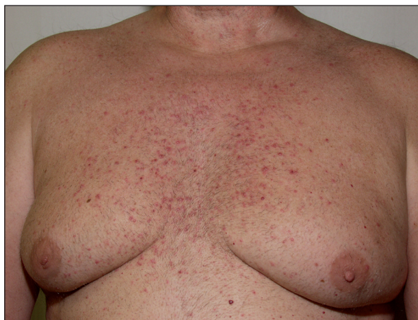
Obr. 4. Akneiformní exantém po cetuximabu.