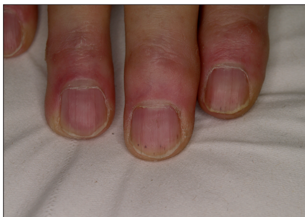
Obr. 12. Třískovité podnehtové hemoragie při léčbě sorafenibem.

pozorují u 40–70 % nemocných (obr. 12), častá je suchost kůže a sliznic, po případě alopecie či dysestézie kůže hlavy (9).