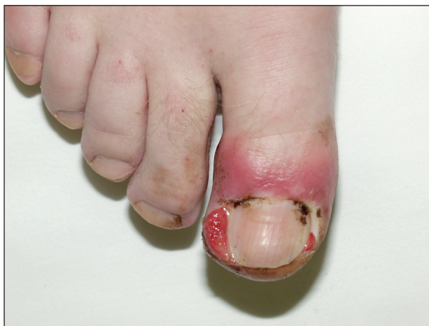
Obr. 9. Paronychia při léčbě EGFR inhibitory.

infúzní reakce (14), podobně i po trastuzumabu, vzácně je popsána vaskulitida a exacerbace psoriázy.