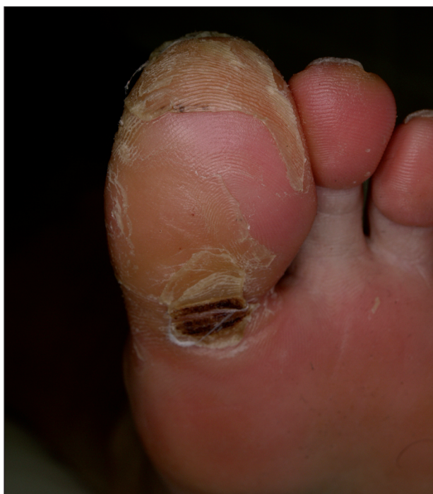
Obr. 11. Syndrom ruka-noha při léčbě sorafenibem.

Sorafenib (až v 48 %) a sunitinib (v 36 %) mohou způsobit za 3 až 4 týdny kožní reakce na rukou a nohou označované jako syndrom ruka-noha (anglicky hand-foot skin reaction ), které se liší od akralních erytémů pozorovaných při klasické chemoterapii (taxany, cytosin arabinosid, 5-fluorouracil aj). V místech tlaku (paty, hlavičky metatarzů) vznikají ostře ohraničené, erytmové, prosáklé otlaky, které jsou silně bolestivé a zhoršují se v horku (obr. 11).