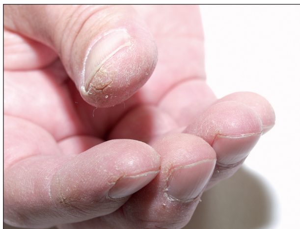
Obr. 8. Fisury na prstech.

Začínají většinou na palcích, ale mohou postihnout i jiné prsty (obr. 9), častá je opět sekundární infekce.