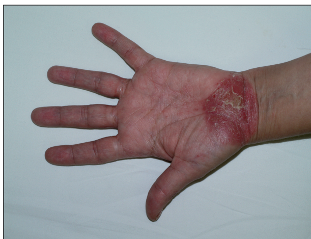
Obr. 2. Psoriatické ložisko na dlani při léčbě etanerceptem.

Paradoxním nežádoucím účinkem léčby je vznik psoriázy při léčení antagonisty TNF \alpha , a to především při terapii revmatoidní artritidy, ankylozující spondylitidy a jiných spondylartritid, Behçetovy nemoci a střevních zánětlivých nemocí. Nejčastěji se objevuje pustulózní psoriáza na dlaních a ploskách (obr. 2). Mechanismus vzniku není znám, ale předpokládá se účast plazmocytoidních dendritických buněk a jejich zvýšená tvorba interferonu \alpha (5). Při podezření na vznik psoriázy během léčby je třeba pátrat po možné vyvolávající příčině (virové či bakteriální infekci, předchozí traumatizaci) a odeslat pacienta k dermatologovi k potvrzení diagnózy klinicky a histologicky. Nemocní většinou mohou pokračovat v léčbě jinými antagonisty TNF \alpha . Profylaktická opatření proti vzniku těchto kožních reakcí zatím nejsou známa. Lokálně se doporučují silně účinné kortikosteroidy, ale i jiná antipsoriatika, při neúspěchu celková terapie stejně jako při závažné psoriáze.