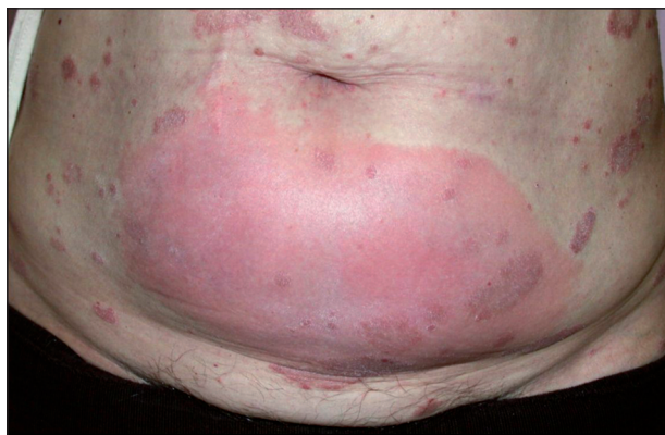
Obr. 1. Lokální reakce v místě aplikace etanerceptu (archiv doc. MUDr. K. Ettler, CSc.).

V místě vpichu subkutánně aplikovaných biologik se může většinou v prvním měsíci léčby objevit lokální reakce v podobě erytému a prosáknutí (obr. 1). Někdy dochází k recidivám lokálních reakcí v místě předchozí aplikace při pokračování léčby (tzv. recall reakce). Pozorují se také případy leukocytoklastické vaskulitidy, ekzémové či lichenoidní projevy, granulomatózní reakce a častější kožní infekce (herpes zoster). Vzácně se udává vznik erythema multiforme, Stevensova-Johnsonova syndromu a toxické epidermální nekrolýzy (3).