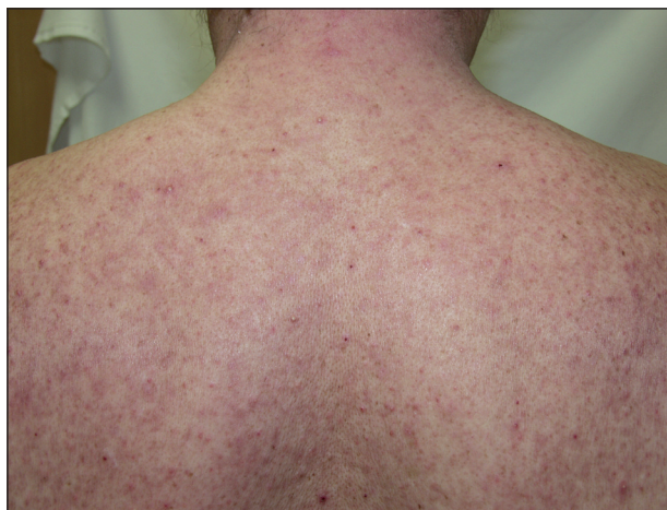
Obr. 3. Akneiformní exantém po erlotinibu.

Pro nežádoucí kožní změny vyvolané antagonisty EGFR se zavedl název PRIDE syndrom (z angl. P apulopustules and/or P aronychia, R egulatory abnormalities of