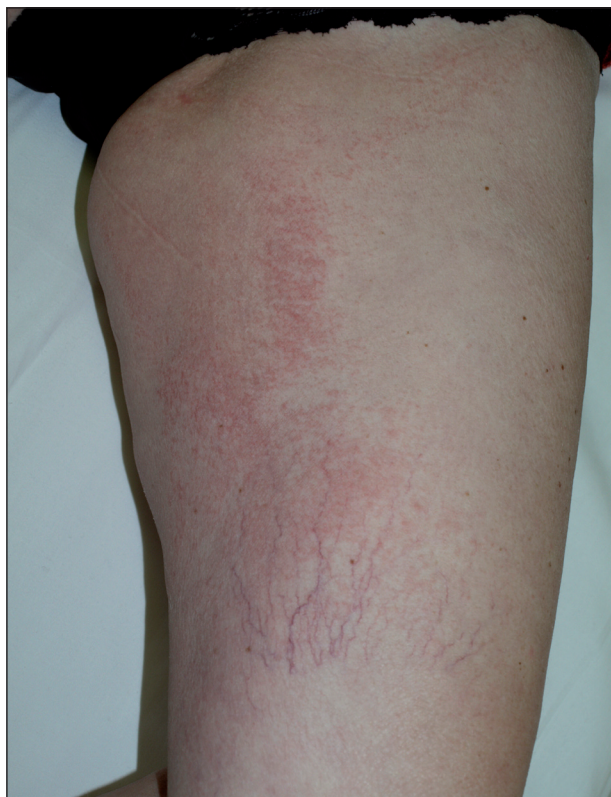
Obr. 7. Ekzémové změny při terapii EGFR inhibitory.

U 10 až 15 % pacientů vznikají po 2 až 4 měsících terapie paronychia s bolestivými pyogenními granulomy.