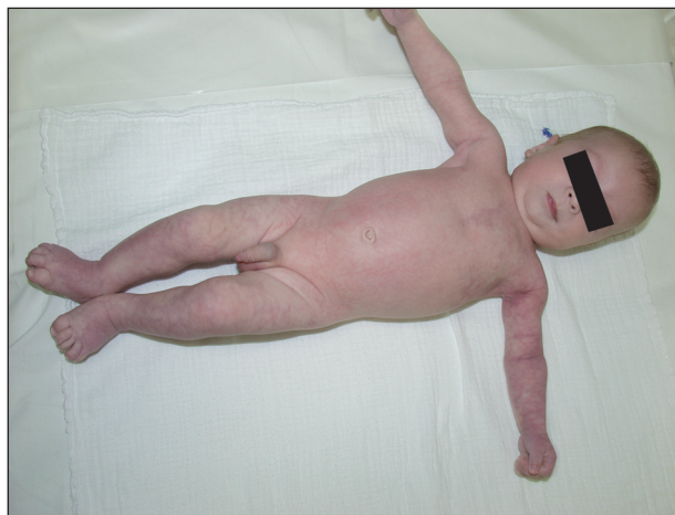
Obr. 3. Celkový pohled.

V současnosti je chlapci 20 měsíců, je pravidelně sledován neonatologem, neurologem, ortopedem a očním lékařem. Dosud nebyla diagnostikována žádná z asociovaných abnormalit. Zpomalený psychomotorický vývoj výrazně postoupil, neurolog konstatuje jen opožděný nástup řeči. Kožní nález zůstal nezměněn, asymetrie končetin je stacionární.