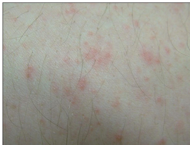
Obr. 2. Detail drobných papulopustulek na zánětlivé spodině bez folikulární vazby

Bylo provedeno bakteriální kultivační vyšetření obsahu pustuly a probatorní biopsie projevu z oblasti nad loketní jamkou. V histologickém nálezu bylo popsáno široce dilatované akrosyringium s pustulou polynukleárů, které byly v menším počtu přítomny i v okolním horním koriu, spolu s nečetnými lymfocyty (obr. 3, 4). Kultivačně byl zachycen pouze Staphylococcus epidermidis ojedinele, myko-