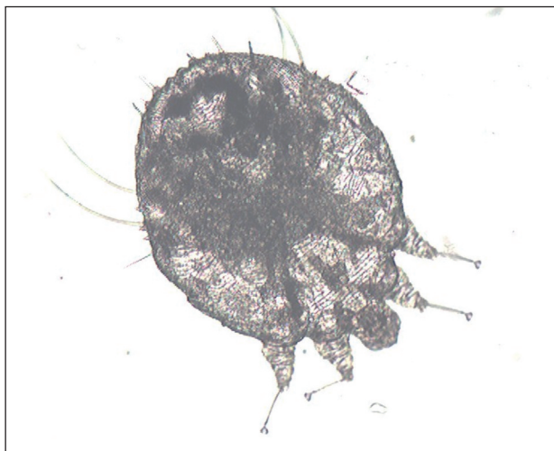
Obr. 5. Mikroskopický nález Sarcoptes scabiei (Danilla T.)

Mikroskopické vyšetrenie z líca aj z hlavy, z nánosov šupín z dlaní aj stupají preukázalo prítomnosť dospelých samičiek a vývojových štádií Sarcoptes scabiei (obr. 4, 5). U matky bolo mikroskopické vyšetrenie tiež pozitívne.