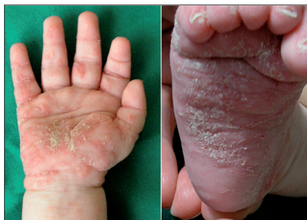
Obr. 3. Scabies crustosa hyperkeratózy a chodbičky (Danilla T.)