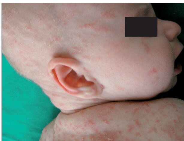
Obr. 2. Scabies crustosa postihnutie hlavy (Danilla T.)