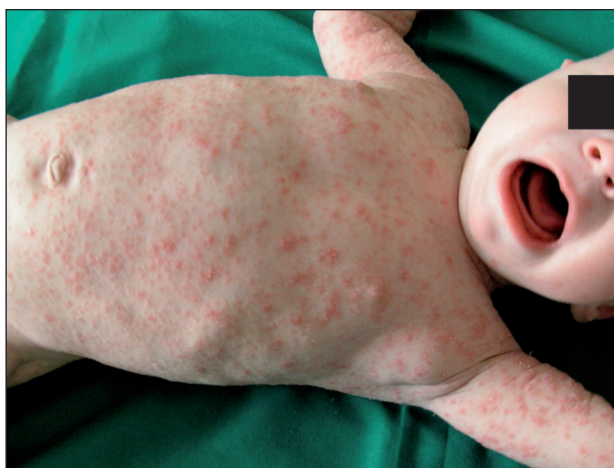
Obr. 1. Scabies crustosa generalizované prejavy (Danilla T.)

Nález pri prijatí: Hypotrofické dieťa so suchou kožou a generalizovaným rozsevom s postihnutím tváre aj kapilícia. Na prechode dlaní v chrbty rúk a na prstoch sa nachádzajú početné chodbičky, na dlaniach nános žltých šupín do hrúbky 1–2 mm. Chodbičky sú aj na nohách pri prechode v stupaje. Šupiny na stupajach sú miernejšie. Chodbičky sa nachádzajú aj na tvári a v spánkovej oblasti hlavy dĺžky 0,5–1 cm. Po celom tele sú papulky až papulovezikulky veľkosti 0,5 mm, červenej farby splývajú