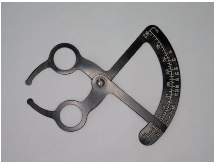
Obr. 3. Hynieho testimetr

řit testimetrem (orchidometrem), např. u nás stále používáme Hynieho testimetr [5] – obrázek 3. Varlata s objemem pod 2 ml jsou zpravidla provázána neplodností. Dále posuzujeme rezistenci varlat nebo zvětšení nadvarlete , jehož agenze je spojena s azoospermii. Vyšetřujeme přítomnost hydrokély , hematokély , spermatokély a hlavně varikokély . Tento konvolut abnormálně dilatovaných, varikózně změněných žil z plexus pampiniformis, označovaný jako idiopatická varikokéla a vyskytující se v běžné mužské populaci v 15 %, zachytíme při komplexním vyšetření muže ze sterilního páru až ve 40 % [17]. Varikokéla je nejčastější příčinou mužské neplodnosti. Její přítomnost musí být správně detekována u pacientů s abnormálním nálezem spermioqramu, včetně azoospermie. Operační řešení varikokély vede ke zlepšení kvality spermatu u 70–80 % pacientů [20]. Klinicky posoudíme i hmatnou část funikulu a per rectum vyšetříme prostatu .