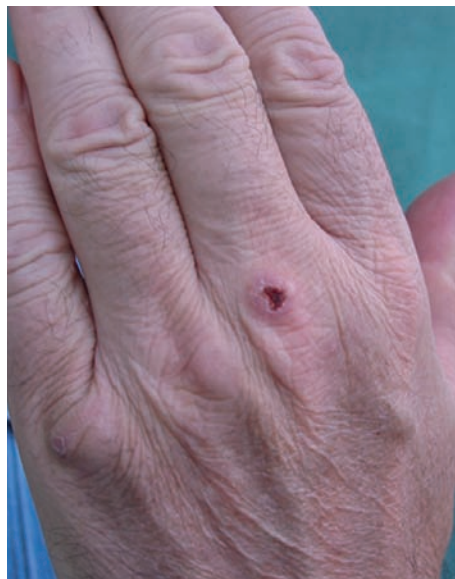
Obr. 3. Klinický nálezn na dorzu levé ruky v září 2009