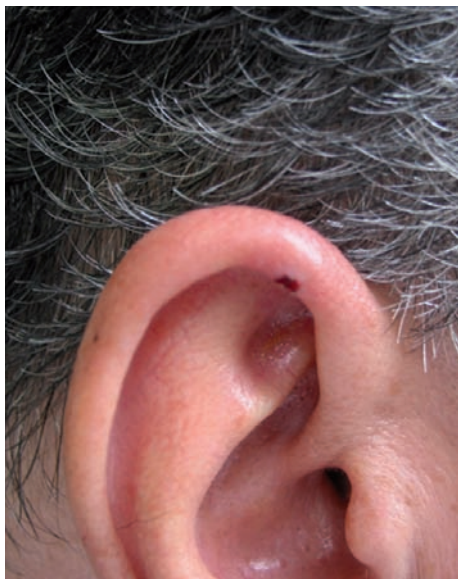
Obr. 2. Klinický nálezn na pravém uchu v září 2009