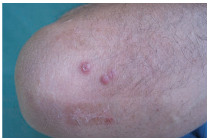
Obr. 1. Klinický nález necharakteristických papul u pacienta na pravém lokti v září 2009

V září 2009 byl vyšetřen na kožní ambulanci pro asi týden trvající asymptomatické kožní projevy. Objektivně bylo přítomno několik růžových tuhých papul s hemoragickou krustou v centru na obou loktech, levé ruce a na pravém uchu (obr. 1, 2, 3).