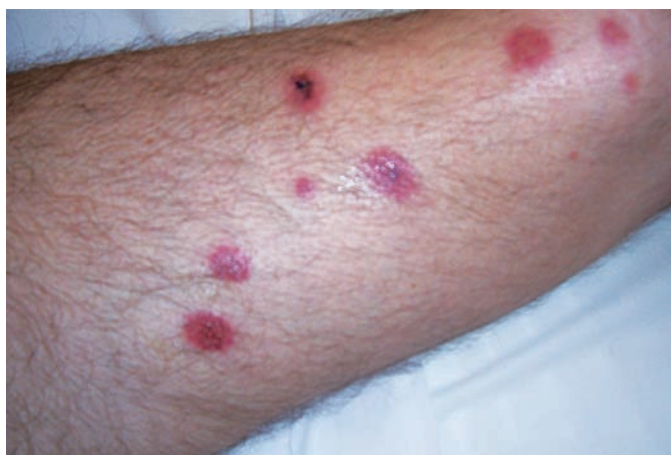
Obr. 2. Klinický obraz – kazuistika 1