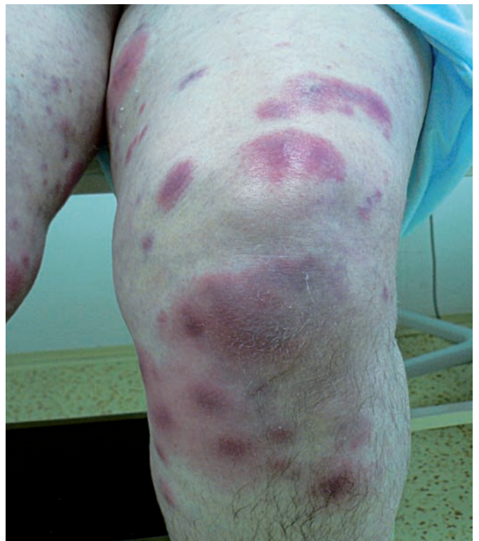
Obr. 5. Klinický obraz – kazuistika 2