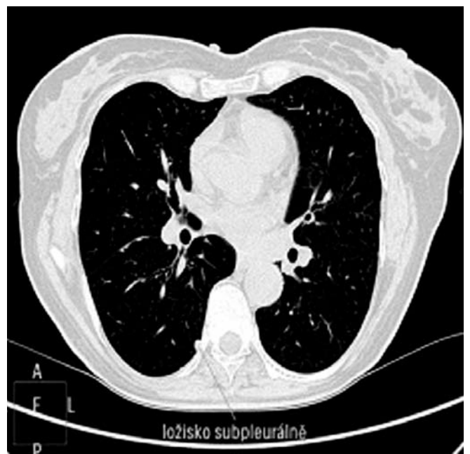
Obr. 4. Nález počítačové tomografie – subpleurální ložisko sarkoidózy

V téže době byla pacientka pro zhoršení očních potíží opakovaně vyšetřena oftalmologem a byl diagnostikován zánětlivý glaukom. Oční nález nebyl pro sarkoidózu charakteristický, chyběly uveitické uzlíky na duhovce i typické granulomy na sítnici. Kožní i plicní postižení velmi dobře regredovalo po nasazení celkové kortikosteroidní léčby Prednisonem (prednisonum) v dávce 0,8 mg/kg hmotnosti a den s postupnou redukcí dávky o 0,2 mg/kg/den vždy zhruba po třech týdnech. Za 3 týdny od zahájení této léčby došlo k podstatnému zlepšení ichtyoziformních projevů, erytém na obličeji zcela regredo-