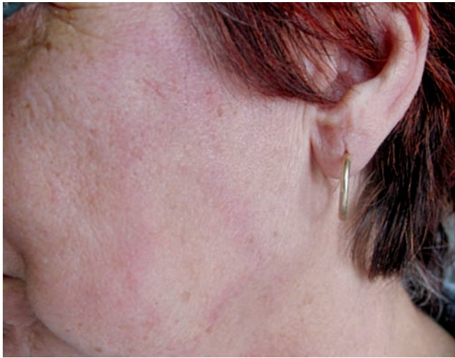
Obr. 2. Anulární erytém na tváři