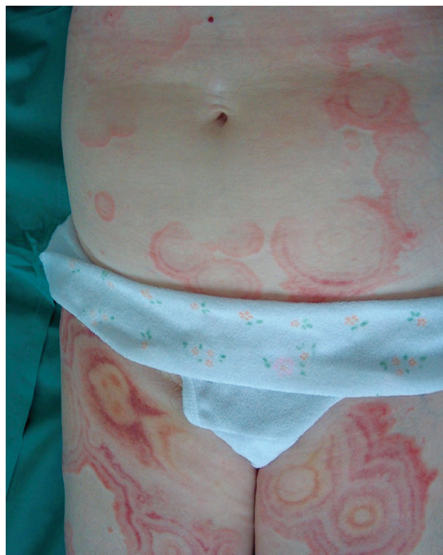
Obr. 1. Erythema gyratum repens

Žena (68 let) byla přijata k hospitalizaci pro tři týdny trávající výsev úporně svědících generalizovaných kožních projevů s nejméně postižením na stehnech a břiše. Předchozí přibližně třítýdenní léčba ve spádové kožní ambulanci antihistaminiky a lokálními kortikosteroidy byla bez efektu, objevovala se stále nová ložiska. Pacientka se léčila s chronickou ischemickou chorobou srdeční, se syn-