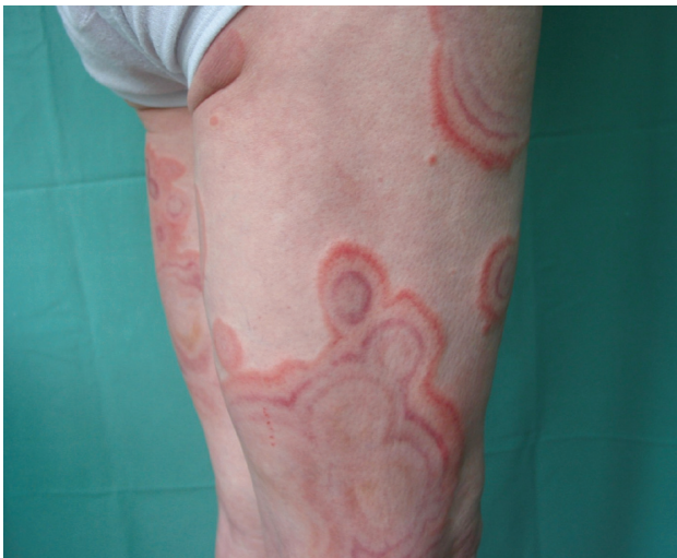
Obr. 2. Erythema gyratum repens

dromem anginy pectoris a hypotyreózou. Operována byla pro apendicitidu v roce 1956 a pro myomy dělohy v roce 1994. Žádným kožním onemocněním ani alergiemi netrpěla. Při přijetí udávala myalgie, artralgie, zvýšenou únavu, hmotnostní úbytek 10 kg za tři měsíce a stěžovala si na bolesti v epigastriu.