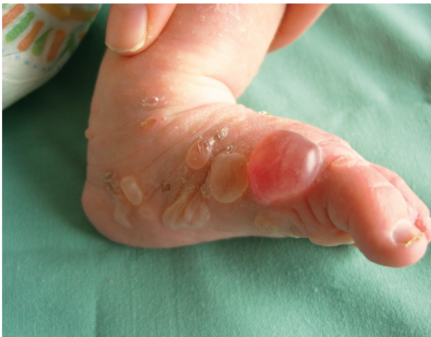
Obr. 1. Stav při přijetí