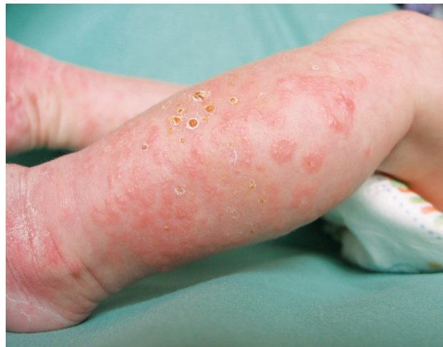
Obr. 2. Stav při přijetí

Při přijetí na kůži dominoval generalizovaný výsev drobných papulovezikul, kdy ušetřena zůstala pouze oblast hýždí, zad a hlavy (obr. 1, 2). Na ventrální straně trupu byla viditelná anulární erytémová ložiska, v jejichž okrajích byly viditelné papulózní a vezikulózní projevy. Ve dlaních a ploskách, také na hranách nohou byly napjaté číré buly. V pravé dlani dominovala bula velikosti asi 2 x 2 cm, již perforovaná, na zápěstích se nacházely zaschlé krusty. Sliznice dutiny ústní, očí a nosu ani nehtové ploténky nebyly postiženy.