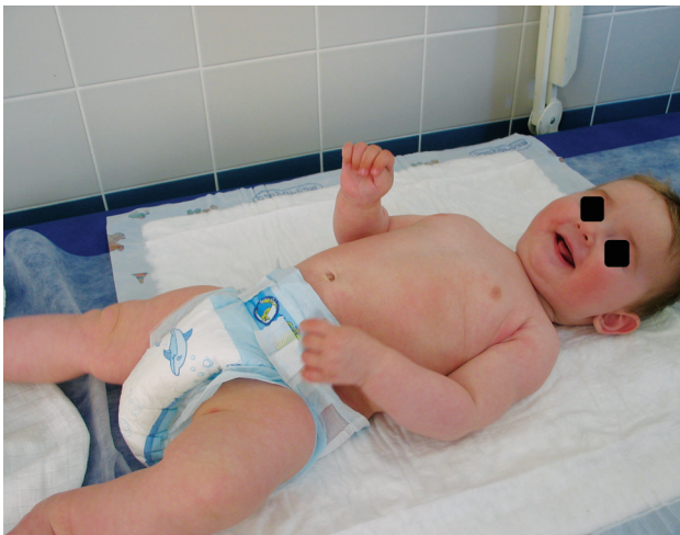
Obr. 5. Stav v 7 měsících věku

Od devátého dne hospitalizace se nové puchýře netvořily. Pacient byl propuštěn do domácí péče čtrnáctý den jen s drobnými krustičkami v dlaních a na ploskách. Sliznice byly nadále nepostíženy. V ambulantní péči byly ponechány lokální kortikosteroidy, 1krát denně pouze jeden týden po hospitalizaci, poté byla kortikoidní externa vysazena. V dalším průběhu v lokální terapii byla aplikována již jen emolienca. Do dvou týdnů od propuštění, tj. od pěti měsíců věku dítěte, byla kůže zcela zhojena (obr. 5). Od dalšího očkování hexavakcínou bylo ustoupeno.