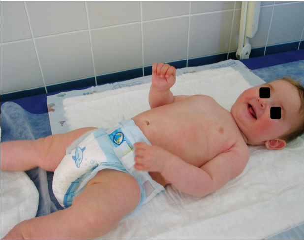
Obr. 5. Stav v 7 měsících věku

Od devátého dne hospitalizace se nové puchýře netvořily. Pacient byl propuštěn do domácí péče čtrnáctý den jen s drobnými krustičkami v dlaních a na ploskách. Sliznice byly nadále nepostíženy. V ambulantní péči byly ponechány lokální kortikosteroidy, 1krát denně pouze jeden týden po hospitalizaci, poté byla kortikoidní externa vysazena. V dalším průběhu v lokální terapii byla aplikována již jen emolienca. Do dvou týdnů od propuštění, tj. od pěti měsíců věku dítěte, byla kůže zcela zhojena (obr. 5). Od dalšího očkování hexavakcínou bylo ustoupeno.