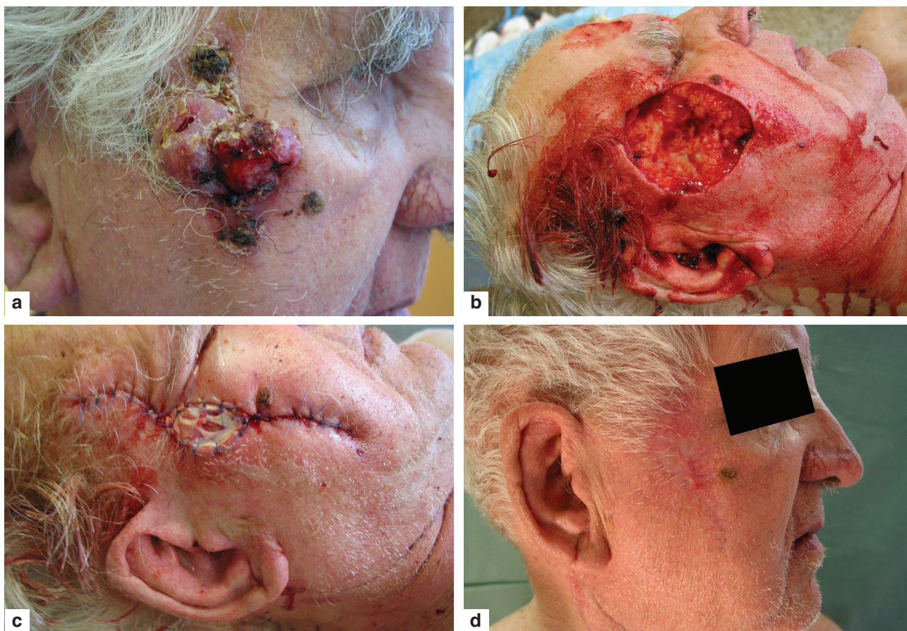
Obr. 2. Bazocelulární karcinom pravé tváře