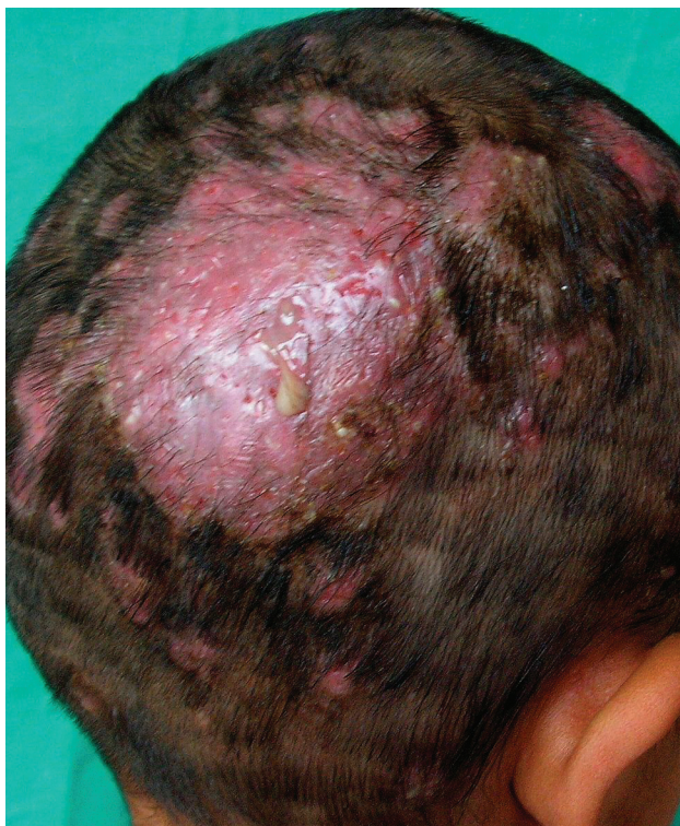
Obr. 1. Tinea capitis profunda

ných vlasov sa objavili ďalšie mierne infiltrované ložiská veľkosti 1–3 cm, spolu 12, s chýbajúcimi vlasmi, na okrajoch s krátkymi odlámanými vlasmi v rôznej výške (obr. 1). Mykologické mikroskopické vyšetrenie šupín odhalilo septované vlákna. Vyšetrenie vlasov preukázalo spóry v retiazkach vo vnútri vlasov – typ parazitizmu endothrix (obr. 2). Mykologická kultivácia s výsledkom Trichophyton tonsurans bola urobená v Mykologickom laboratóriu Detskej dermatovenerologickej kliniky LFUK a DFNSP. Kolónie mali svetlo hnedú farbu, jemný povrch podobný zamatu s výrazne sprehybaným povrchom a spodnej strane hnedé zafarbenie (obr. 3 a, b). Mikroskopickým vyšetrením z kolónií sme zistili relatívne široké hýfy s početnejšími septami s vetvením v pravom uhle, mikrokonídie rôznych tvarov a veľkostí, ojedinelé chlamydo-spóry.