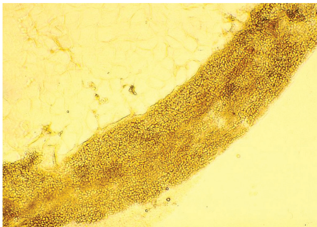
Obr. 2. Mikroskopický obraz vo vlase – typ endothrix

ných vlasov sa objavili ďalšie mierne infiltrované ložiská veľkosti 1–3 cm, spolu 12, s chýbajúcimi vlasmi, na okrajoch s krátkymi odlámanými vlasmi v rôznej výške (obr. 1). Mykologické mikroskopické vyšetrenie šupín odhalilo septované vlákna. Vyšetrenie vlasov preukázalo spóry v retiazkach vo vnútri vlasov – typ parazitizmu endothrix (obr. 2). Mykologická kultivácia s výsledkom Trichophyton tonsurans bola urobená v Mykologickom laboratóriu Detskej dermatovenerologickej kliniky LFUK a DFNSP. Kolónie mali svetlo hnedú farbu, jemný povrch podobný zamatu s výrazne sprehybaným povrchom a spodnej strane hnedé zafarbenie (obr. 3 a, b). Mikroskopickým vyšetrením z kolónií sme zistili relatívne široké hýfy s početnejšími septami s vetvením v pravom uhle, mikrokonídie rôznych tvarov a veľkostí, ojedinelé chlamydo-spóry.