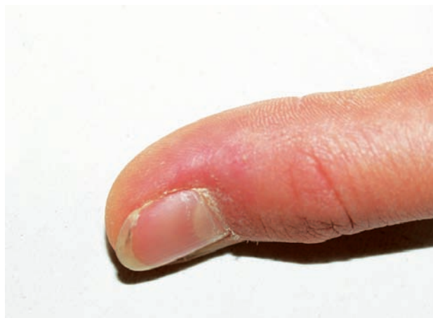
Obr. 1b. Nález po 1 ošetření pulzním barvivovým laserem