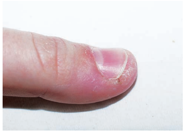
Obr. 2b. Nález po 2 ošetřeních pulzním barvivovým laserem

Léčba bradavic pulzním barvivovým laserem byla zadáním několika studií, na jejichž podkladě ji lze považovat za ověřenou. Efektivita léčby se ovšem u jednotlivých prací značně liší. Kenton-Smith a Tan dosáhli 92% zhojení bradavic při ošetření pulzním barvivovým laserem po průměrném počtu 2,8 expozice [3]. Kauvar uvádí 99% úspěšnost této léčby u bradavic na trupu a anogenitálně, 95% úspěšnost na dlaních, 84% úspěšnost na chodidlech a 83% úspěšnost při léčbě periungválních bradavic [2]. Většina prací uvádí horší efekt pulzního barvivového laseru, který je ale většinou srovnatelný s výše uvedenými běžně používanými metodami jako kryoterapie a aplikace lokálních keratolytik [4, 5, 9]. Sethuraman potvrdil úspěš-