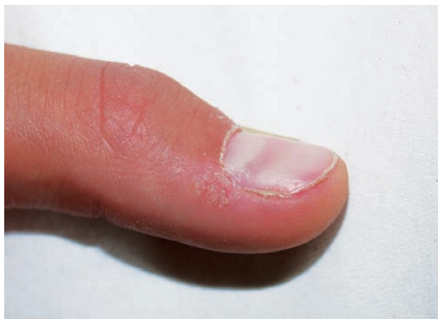
Obr. 1a. Periungvální bradavice před léčbou

Mezi vedlejší účinky léčby bradavic cévním laserem