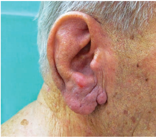
Obr. 1. Klinický obraz