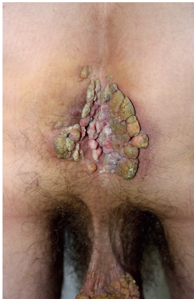
Obr. 2. Condylomata acuminata gigantea lokalizované perianálne

CT prítomná atfia mozgu. V epidemiologickej anamnéze uviedol viaceré, aj náhodné nechránené sexuálne vaginálne kontakty. U partneriek podobné prejavy nepozoroval. Sexuálny pomer s mužmi negoval. Dopusiať absolvovaná lokálna terapia tekutým dusíkom a 5 % imiquimodom v kréme bola s minimálnym účinkom a pre nedostatočnú spoluprácu pacienta boli obidve liečebné metódy aplikované len krátku dobu. Pre slabé sociálne správanie bol pacient posledných 2,5 mesiacov bez liečby. Pacient subjektívne pociťoval bolestivosť v mieste lézií. Kvôli rozsiahlej tumoróznej mase na skrôte mal ťažkosti pri chôdzi, čo ho priviedlo znovu k dermatológovi. Pri vyšetrení boli v uvedených lokalitách prítomné početné, na povrchu drsné karfiolovité útvary papilomatózneho vzhľadu na pohmat mäkkej konzistencie, s výraznou fragilitou lézií v perianálnej lokalizácii. Farba lézií kolísala od ružovej, hneď až po zeleno sfarbené patologické prejavy s výrazným odórom a secernáciou spolu so spontánnym krvácaním, ktoré sa zväčšovalo pri palpácii. Na oboch rukách mal početné vulgárne bradavice veľkosti od 3 do 5 mm.