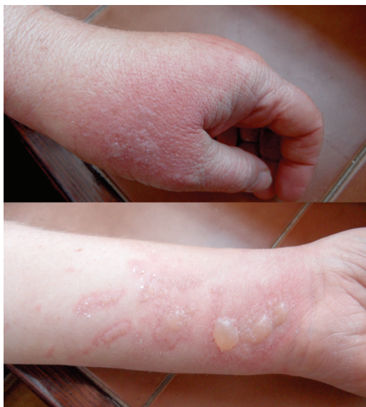
Obr. 10. 43letá žena – 72 hodin po zpracování kořenové zeleniny (říjen)

titis). Při zpracování zeleniny, bylin či přípravě potravin vždy v místě kontaktu a potřísnění (obr. 8, 9, 10). Typické obrazy jsou pak po používání kosmetik s příměsí bergamotu (parfémové kompozice ze silice Citrus bergamia – Eau de Cologne), hnědočervené pásy následující stékající tekutinu s lokalizací na obličeji, krku a výstřihu. Popsány jsou také generalizované reakce po aromaterapii s použitím bergamotového oleje [20, 47]. V případě přípravy nápojů z citrusů bývají projevy na prstech rukou, při jejich konzumaci na slunci cheilitidy a pericheilitidy. Nepostihuje místa chráněná před UV zářením oděvem, extrémním příkladem je tzv. inverse socking distribution – inverzní ponožková distribuce [52]. Postižené plochy nesvědí, pacienti udávají pálení a bolest. Pro stanovení diagnózy jsou velmi důležité anamnestické údaje, v některých případech je vhodná konzultace botaniků. Postižení bývají zejména zahrádkáři, farmáři, lesní dělníci, bylinkáři a lidé trávící volný čas v přírodě [34]. Fytofotodermatitidy mohou způsobovat profesionální postižení a měly by být také hlášeny. První literární zmínka o profesionálním postižení pochází z roku 1926 – šlo o dermatitidy po celeru u prodávачů zeleniny [30]. Onemocnění se vyskytuje spíše v pozdním létě, kdy bývá zastoupeno více UVA záření a v rostlinách je vyšší koncentrace psoralenů [27, 35, 38, 43]. Je také častější v subtropických a tropických oblastech pro hojnější a různorodější flóru i pro klimatické podmínky [12].