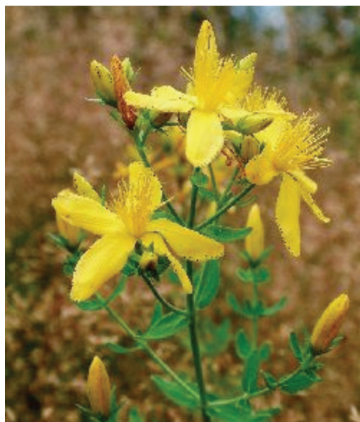
Obr. 2. Hypericeae ( Hypericum perforatum )

gulární (angelicinový typ). Jejich fyziologickou funkcí v rostlinách je ochrana před plísňovými infekcemi. Jsou termostabilní a mimo fototoxického efektu byla u zvířat prokázána mutagenita a kancerogenita. Množství furokumarinů v rostlinách závisí na růstovém období, místu výskytu a roč-