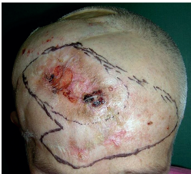
Obr. 1a. Recidiva bazaliomu na hlavě před operací v roce 2008