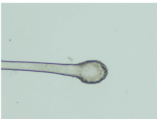
Obr. 2. Kyjovitý bulbus telogenního vlasu ve světelném mikroskopu (zvětšení 40krát)

větší procento vlasových folikulů dostane do telogenní fáze [27]. Pro vlasy, které vypadávají spontánně nebo při činnostech, jako je mytí a česání, je charakteristický malý keratinizovaný bulbus na proximálním konci vlasu (obr. 1). Lze je také snadno získat pomocí trakčního testu (obr. 2). Padání vlasů „i s kořínky“ pacientky často vnímají znepokojivě, ale paradoxně přítomnost zmíněného bulbu je spíše pozitivním zjištěním. Osoby s TE nebývají postiženy kompletní ztrátou vlasů (málokdy vypadne více než 50 % vlasů), i když v ojedinělých případech může být prořídnutí velmi výrazné. Nepřítomnost tohoto zduření by svědčilo pro anagenní respektive dystroficko-anagenní typ efluvia (viz níže). Výjimečně může TE postihnout i další oblasti, např. řasy nebo pubické ochlupení.