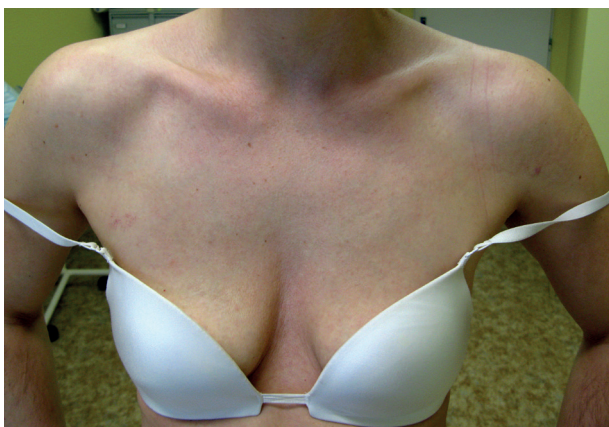
Obr. 1. Plocha svráštělé kůže postihující celý výstřih a horní partii hrudníku