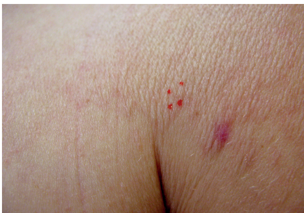
Obr. 2. Hranice postižené kůže s jizvou po předchozí biopsii a označením biopsie opakované