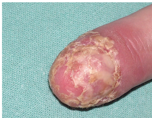
Obr. 5. Acrodermatitis continua suppurativa (Hallopeau)

Acrodermatitis continua suppurativa (Hallopeau) je považována za variantu pustulózní psoriázy omezenou na oblast distálních falangů, často sdruženou s destruktivními přílehlých kostních struktur [4, 8, 11]. Onemocnění