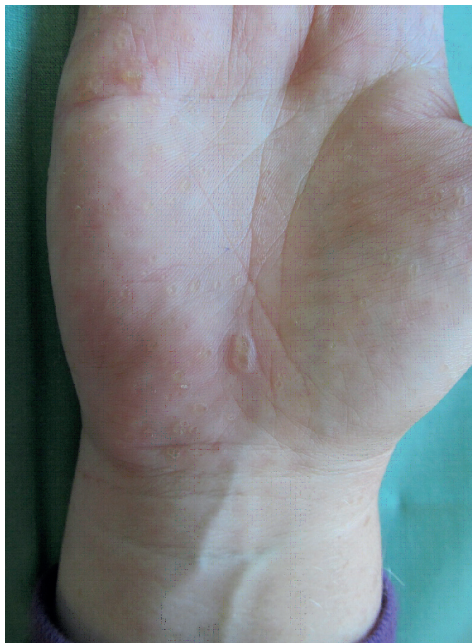
Obr. 1a, b. Hyperkeratotické papule

du 2011 musela být ukončena pro komplikace – cheilitis sicca a zvýšení transamináz. Opakované histologické vyšetření v roce 2012 popsalo vkleslinu kožního povrchu o průměru 3 mm vyplněnou hyperkeratotickým čepem, na spodině mírně akantotickou epidermis (obr. 2). Tento histologický nález odpovídal klinické diagnóze punktátní keratodermie. Při hospitalizaci na kožním oddělení v roce 2014 byl nasazen lokální isotretinoin a vazelína s 10 % salicylové kyseliny, po kterých se kožní nález podstatně zlepšil. Tato léčba pokračuje spolu s pravidelnou pedikérskou péčí – obrušováním frézou, změkčováním