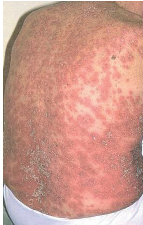
Obr. 2. Generalizovaná pustulózní psoriáza

Klinický obraz je zpravidla dosti bouřlivý. Febrilie a celková zchvácenost v úvodu jsou následovány výsevy živě červených postupně splývajících makul. Na zánětlivé spodině dochází k různě intenzivní tvorbě pustul (obr. 2). Projevy se postupně šíří po celém těle a někdy i na sliznice dutiny ústní [10, 11]. Nové pustulózní výsevy jsou provázeny subfebriliemi. Při dlouhodoběji přetrvávajícím neléčeném či terapeuticky nezvládnutém stavu se může rozvinout elektrolytová a proteinová dysbalance. Pacienti mají zvýšený sklon k rozvoji bakteriálních infekcí. Laboratorně je signifikantní elevace zánětlivých markerů (sedimentace, CRP, leukocytóza), hypokalcémie a hypoalbuminémie. V diferenciální diagnóze je nutné odlišit zejména GPP bez asociace s LP od akutní generalizované exantematické pustulózy (AGEP), jejíž etiologie je poléková a na rozdíl od psoriázy von Zumbusch poměrně rychle regreduje bez recidiv [11]. V individuálních přípa-