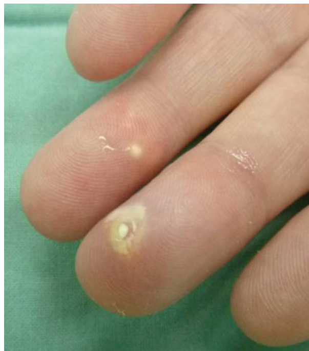
Obr. 1. Tofy na prstech

Žena (47 let) se závažnou psoriázou léčenou biologickou léčbou si při pravidelné kontrole stěžovala na nově vzniklé bolestivé uzlíky na prstech. Lupénku měla od 20 let věku, asi od 30 let se začala léčit na revmatologii v místě bydliště pro psoriatickou artritidu, nejdříve metotrexátem a poté leflunomidem, krátce měla i celkové kortikosteroidy v nízké dávce. Na naší klinice byla léčena infliximabem od roku 2008, poté etanerceptem a od roku 2010 adalimumabem s velmi dobrým účinkem na kožní i kloubní postižení. Během sledování na našem pracovišti si jen občas stěžovala na bolesti a otoky kloubů, což jsme přisuzovali současné psoriatické artritidě. Nemocná byla obézní (BMI 31) a léčena pro hypotyreózu, při cíleném dotazování poslze přiznala každodenní popíjení několika piv a příležitostně i pár sklenek tvrdého alkoholu. V laboratoři měla dlouhodobě zvýšené jaterní testy včetně glutamyltransferázy, v době zmiňovaného vyšetření pak byla zjištěna extrémně vysoká hladina kyseliny močové (600 \mu\text{mol/l} ; norma 140–360 \mu\text{mol/l} ), hypertriglyceridémie a hypercholesterolemie. Sonografie břicha prokázala steatózu jater.