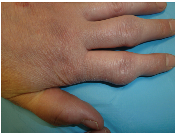
Obr. 3. Deformity ručních kloubů

Na palmární straně prstů obou rukou byly patrné běložlutavé tuhé uzlíky do 5 mm velké, místy jakoby se vylučoval křídový materiál (obr. 1, 2). Okolo loktů, zápěstí a proximálních interfalangeálních kloubů prstů ruky byly nebolestivé až 3 cm velké hnědavě červené hrboly a deformity (obr. 3). Z projevu na prstu byla provedena probatorní excize, histopatologické vyšetření prokázalo dnavé tofy. Kožní nález při biologické léčbě byl minimální se skórem rozsahu a závažnosti psoriázy PASI <1.