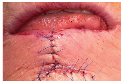
Obr. 9. Sutura rány po operaci dolního rtu podle Szymanowského