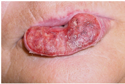
Obr. 4. Exofytický rostoucí rozsáhlý spinocelulární karcinom dolního rtu (T3) indikovaný k radikální resekcii a rekonstrukci pomocí místních posunů tkání (operace podle Szymanowského)

statisticky významné zvýšení počtu metastáz již u nádorů větších než 15 mm [9].