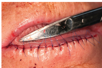
Obr. 7. Sutura rány po celkové excizi retní červeně („lip shaving“) dolního rtu

Spinocelulární karcinom dolního rtu je onemocnění vyskytující se především ve starší populaci. Má poměrně dobrou prognózu. Včasný záchyt spojený s menším rizikem komplikací, lepším estetickým výsledkem (obr. 7, 8, 9) a velkou šancí na úspěšnou léčbu přitom nebývá problematickým vzhledem k tomu, že pacienti obvykle sami vyhledávají odbornou pomoc, neboť nádor je na velmi viditelném místě. Je však nutné onemocnění včas rozpoznat a pacienta odeslat k řešení na vhodné onkologické nebo chirurgické pracoviště s dostatečnými zkušenostmi s daným typem nádoru (vhodné je např. pracoviště ma-