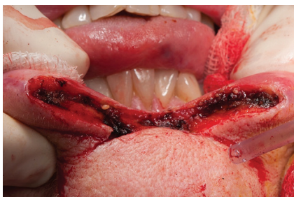
Obr. 6. Kvadratická excize dolního rtu

Radioterapie byla preferovanou terapií v 50. a 60. letech, poté její význam poklesl a přednost se začala dávat chirurgickému řešení, takže byla využívána především jako adjuvantní terapie nebo u pacientů, kteří nemoh-