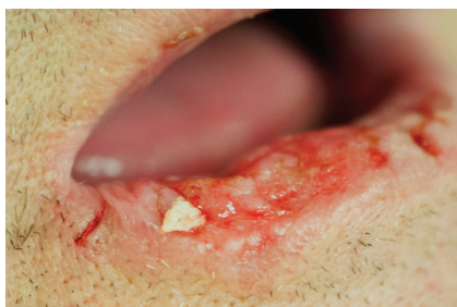
Obr. 2. Erozivní forma spinocelulárního karcinomu dolního rtu (T2) indikovaného ke kvadratické excizi