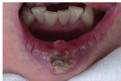
Obr. 3. Ulcerózní spinocelulární karcinom dolního rtu krytý krustou (T1), indikovaný svou velikostí ke klinovité excizi