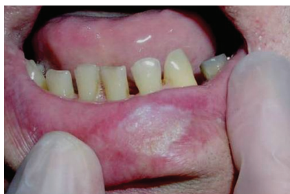
Obr. 1. Spinocelulární karcinom dolního rtu (T1) připomínající hyperkeratózu dolního rtu

Prognóza SCK rtu je relativně dobrá díky jeho viditelnosti a včasnému záchytu (pacientovi léze kosmeticky vadí, proto spíše vyhledá lékaře). Velká většina nádorů je zachycena ve fázi T1N0M0 nebo T2N0M0. Pětileté relativní přežití (tedy po vztažení přežívání pacientů s SCK na přežívání srovnatelné skupiny bez diagnózy SCK) pro tyto časné fáze se v literatuře udává v intervalu 85–99 % [16, 31, 35, 38]. Metastázy na krku se u pacientů s SCK dolního rtu objevují podle různých studií ve 3–29 % případů [16, 26, 36] a v případě jejich výskytu je prognóza výrazně horší – pětileté přežití se udává jen v 25–50 % [1, 36, 41]. Výskyt metastáz souvisí především s velikostí a tloušťkou primárního tumoru a stupněm diferenciací (dobře diferencované nádory mají menší množství metastáz než nediferencované). Častější výskyt metastáz je spojen s rekurentními nádory [16, 26, 41]. Jako hranice, za kterou je již vznik krčních metastáz velmi pravděpodobný, se udává tloušťka nádoru 5 mm [30], případně velikost nádoru 3 cm [41]. Některé studie však detekovaly