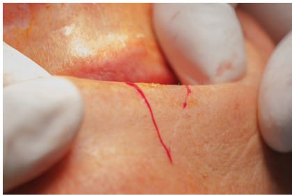
Obr. 5. Naznačení klínovité excize dolního rtu vlevo

některého z rekonstrukčních postupů (např. podle Szymanowského, Karapandzice, Gilliese...) – obr. 7–9. Nutná je opět velmi pečlivá sutura. Tyto operační techniky lze kombinovat, kvadratickou excizi je možno doplnit o resekci retní červeně. U rozsáhlých tumorů prorůstajících do kosti resekujeme kromě měkkých tkání i postižené kosti [18].