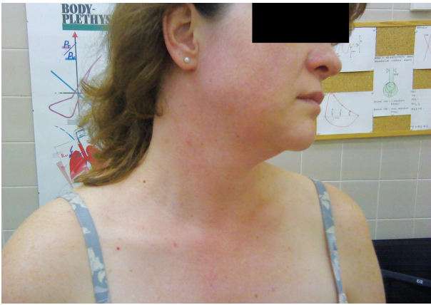
Obr. 5. Snímek erytému na krku a v obličeji po provedení expozičního testu